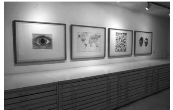
Instal·lació de Teorema, 2010 (políptic de quatre dibuixos) a la galeria Joan Prats-Artgràfic (Barcelona, desembre de 2011)

Conversa per correu electrònic a partir d'una trobada al taller d'Oriol Vilapuig el 27 d'octubre de 2012.