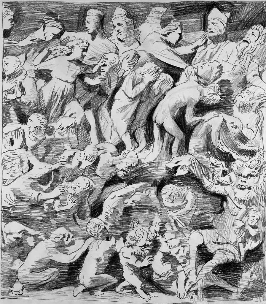
Teorema 3 Rèprobes, 2010 Grafit sobre paper 70 x 100 cm

Oriol Vilapuig: Abans d'entrar en consideracions que tenen a veure amb la definició d'experiències i inquietuds que circulen pels meus darrers treballs, m'agradaria constatar la voluntat que qualsevol de les meves peces es manifestin des de la seva presència i sensació física dins uns temps i un espai de contemplació únic i particular. Aquesta experiència de contemplació és per a mi fonamental i serà la que d'alguna manera inaugurarà totes les altres. És a partir del moviment d'avançada i retrocés que la presència física i material de l'obra ens provoca quan la contemplem, i això té a veure amb aspectes d'orde fisiològic, més que no d'ordre purament intel·lectual, que es mobilitzaran experiències, emocions i reflexions en l'espectador. D'aquí el