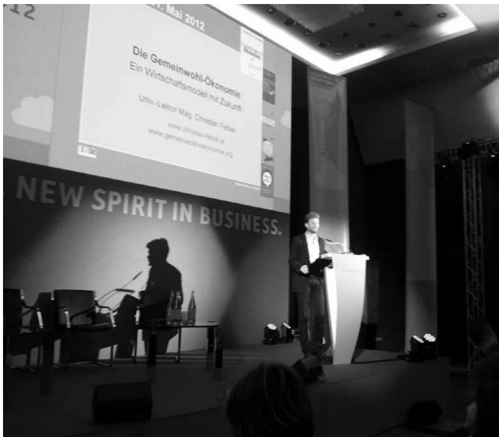
Christian Felber

Què és l'economia del bé comú? Felder ho explica al llibre Neue Werte für die Wirtschaft [Nous valors per a l'economia] publicat el 2008 2 . No és casualitat que fos l'any en què el holding nord-americà de serveis financers Lehman Brothers va caure i va donar el tret de sortida a allò que ens presenten reiteradament com una crisi però que amaga, de facto , un atac sistemàtic i definitiu del capitalisme financer per exaltar