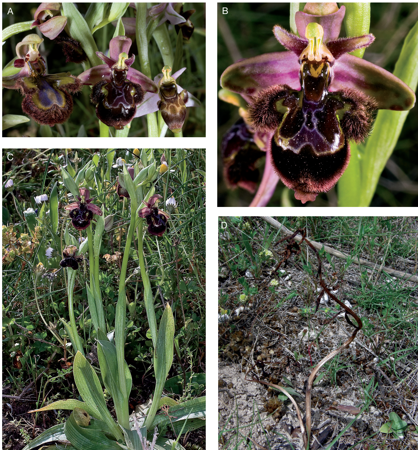
Fig. 1. Ophrys × castroviejoii : A , inflorescencia entre sus progenitores en la localidad clásica; B , detalle de una flor; C , aspecto general. D , detalle de un individuo tras la floración sin llegar a formar cápsulas.

Hábitat: Los ejemplares encontrados en Alicante crecen en pastizales de Teucrio-Brachypodium retusi O. Bolòs 1957 nom. mut. , bajo ombrotipo subhúmedo y termotipo termomediterráneo, al igual que en Málaga, mientras que en Lérida aparece bajo ombrotipo seco y termotipo mesomediterráneo.