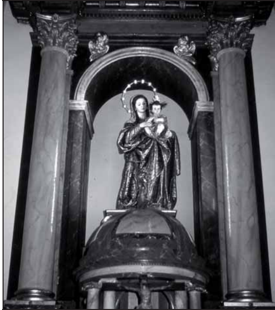
2. Nuestra Señora de la Misericordia. Siglo XVII. (Juan de Mesa. Sevilla, 1611). (Hospital de Antezana).