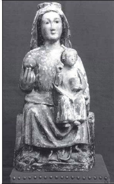
4. Virgen Majestad siglo: XII-XIII. (Hospital de Antezana).