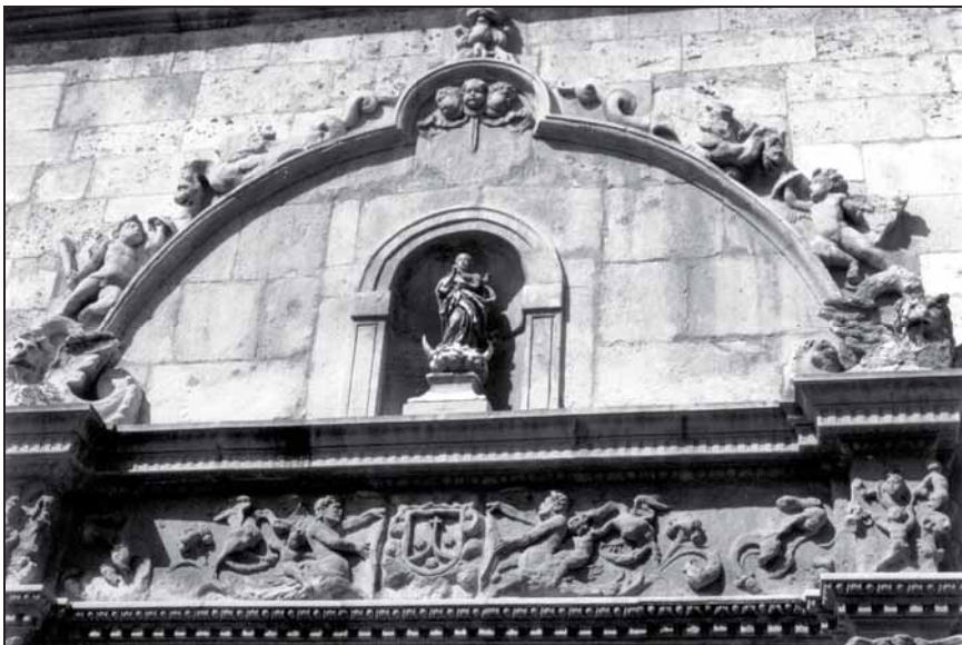
5. Imposición de la casulla a san Ildefonso por Santa María. Relieve. S. XVI. Capilla colegial y universitaria de san Ildefonso, del Colegio Mayor del mismo nombre.