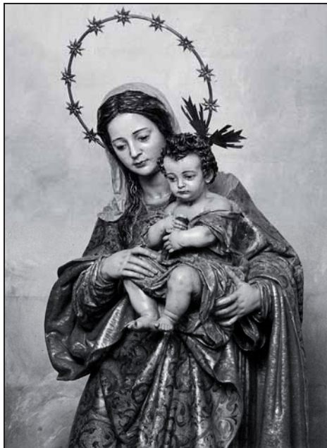
3. Detalle de Nuestra Señora de la Misericordia. (Hospital de Antezana)