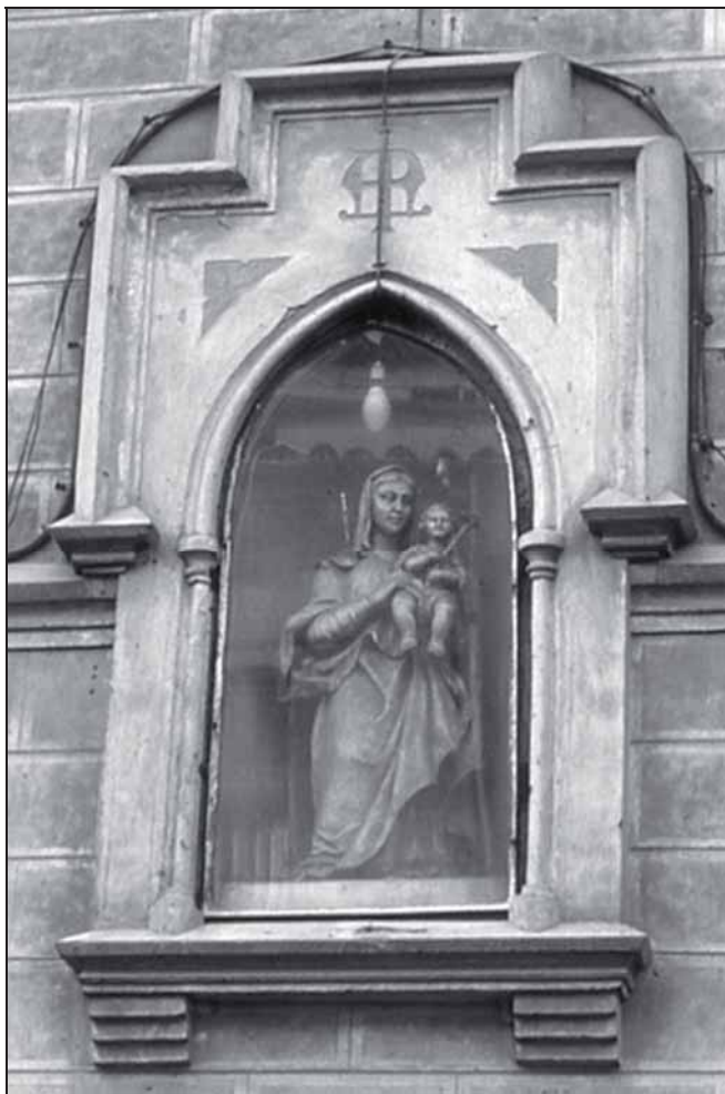
1. Nuestra Señora de la Misericordia. Siglo XVI. Fachada de la iglesia del Hospital de la Misericordia o de Antezana, (El hospitalito).