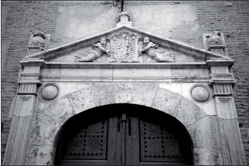
6. La Inmaculada Concepción con Niño, franciscana. Relieve. S. XVI. Portada del convento de las Franciscanas Concepcionistas de santa Úrsula.