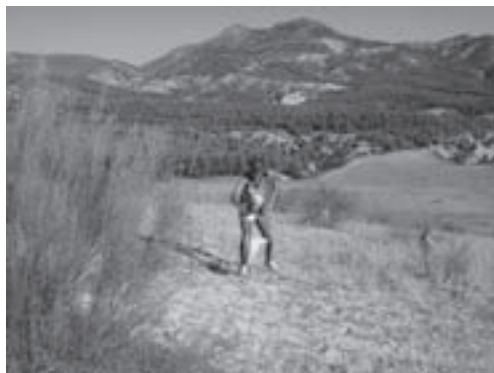
El espectacular terreno de las Ramblas (Campo de Tiro)

Así pasó la noche, unos a descansar, y otros, como otros años, a disfrutar de las cálidas sombras paseando por la Estación o las calles de Cabra, tapeando en los bares o haciendo la ruta de los “pubs” hasta altas horas de la madrugada.