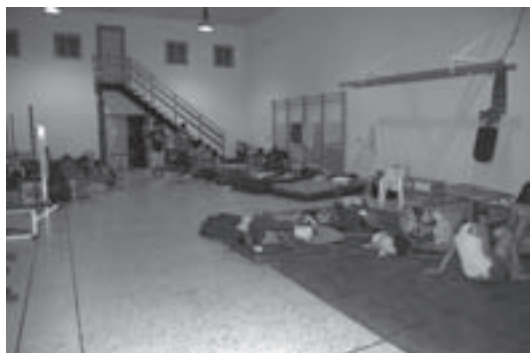
El tradicional suelo duro (Gimnasio)

cada uno ya dispone del resto de la tarde para aprovechar el cálido verano ... unos haciendo unas tapas en el Bar Andalucía, otros subiendo a Cabra para alojarse en los suelos duros, o los apartahoteles, o el camping, y cenar o echar una copa en los bares y pubs cabrileños, y los organizadores para preparar la etapa larga en los Romerales.