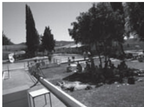
¡y chapuzón también en la piscina municipal!

A pesar de ello, se incluyó este punto de agua, así como también en la zona de entrega de mapas, añadidos los dos al habitual de meta.