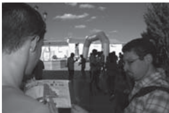
Arco de meta, mapa y bocata en Huelma