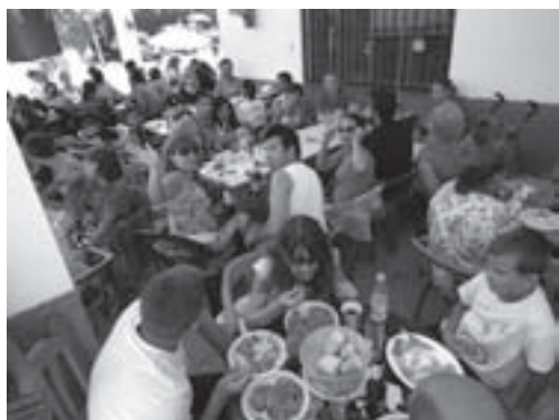
La tradicional paella