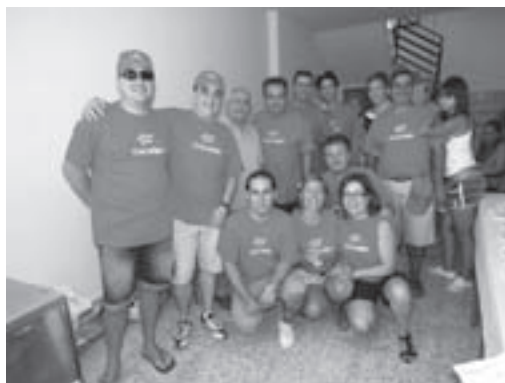
El staff de Acacyr

ramblas. Ese fue el terreno y mapa usado, pero a la hora de la verdad el mapa abarcó más, una buena parte de las ramblas grandes, con una espectacularidad manifiesta. Un área muy apta para entrenamientos de élite donde se conjugan físico y técnica. Así lo atestiguaron muchos de los participantes, cansados por el esfuerzo pero agradablemente sorprendidos por las peculiaridades de la zona ... “para hacer una liga nacional” en palabras de varios de ellos. Un terreno por otra parte mucho más agradable en la primavera, sin calor y con la hierba y las flores y el suelo tierno.