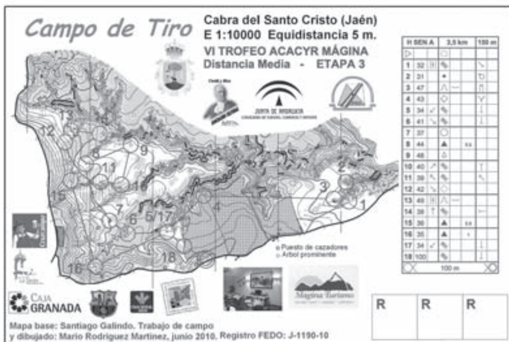
Mapa Campo de Tiro - E3 Media Distancia Hombres Senior