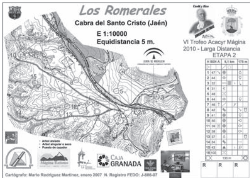
Mapa Los Romerales - E2 Larga Distancia Hombres Senior