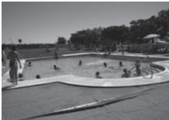
Chapuzón en la piscina del Camping

pack para todo aquel orientador que quisiera alojarse también en los días previos de las fiestas patronales, con descuentos y diversos usos de las instalaciones. Más de 200 raciones se repartieron, amén de un indeterminado número de cañas de cerveza. Muchos de los asistentes, previamente, pudieron disfrutar de un alivante chapuzón en la piscina.