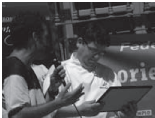
reconocimiento a casa herminia

Una vez comprobado habían llegado todos los corredores, rápidamente desplazamiento hacía Cabra, donde ya el staff de Acacyr había preparado los tradicionales platos de jamón y queso, y el barril de cerveza y los refrescos. En poco tiempo se preparó un pequeño espacio con fotos y pancartas en uno de los extremos de la plaza del Ayuntamiento, y de forma puntual se procedió a la entrega de diplomas y reconocimientos. En esta edición, un reconocimiento expreso a casa Herminia,