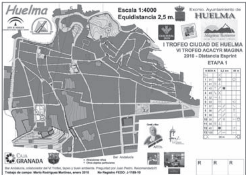
Mapa Huelma - E1 Sprint Hombres Senior