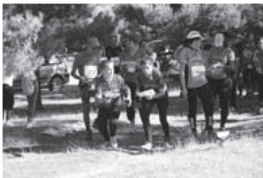
Salida en Los Romerales

Los Romerales ... paraje extraordinario que estará ligado siempre a la orientación en Jaén. Su descubrimiento y levantamiento de mapa ya lo hemos narrado en anteriores artículos de Contraluz. En estos años pasados desde la espectacular carrera nacional-internacional WRE, el pinar había pasado por un momento crítico a raíz de una granizada, que dejó vastas áreas amarillas y con los árboles moribundos, pero afortunadamente la madre naturaleza lo supo curar con estos dos años de abundantes lluvias que han