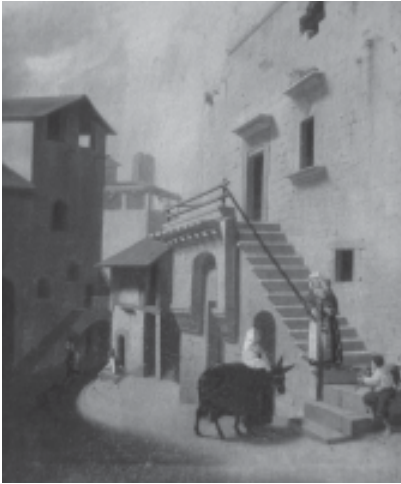
Vista d'un carrer de Solivella

casa, en la qual també trobem un nen assegut amb un gos. L'altra subjecta un ase. Es veuen altres edificacions. Més enllà, però en el mateix carrer, hi ha un home assegut i una dona que du un gerro damunt del cap.