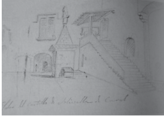
Vista del pati del castell de Solivella

Dibuix que es troba inserit dins de l'anomenat «Quaderns d'Apunts de Catalunya i Aragó». En el llibre Els castells Catalans trobem la següent descripció sobre el pati: «[...] En entrar, es troba un pati quadrat, al mig del qual hi ha la cisterna. És un monument de pedra piramidal, encimerat per l'estàtua de Sant Jordi amb el drac vençut. En la peanya, dos àngels esculpits, sostenint les armes nobiliàries dels Llorac [...]» (p. 360) (fig. 5).