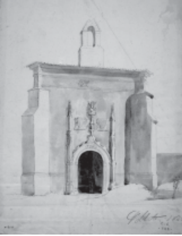
Vista de la capella de la Verge, Sant Miquel i Sant Jordi. Monestir de Poblet.

Daurada. El pintor mostra la figura d'un home amb barret que subjecta un objecte amb la mà dreta i entra dins de la capella.