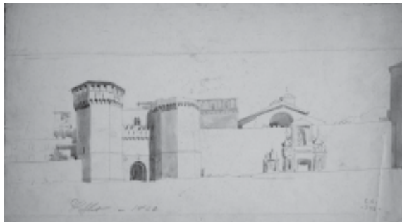
Vista de la façana de l'església i de la porta reial. Monestir de Poblet.

Ens ofereix una àmplia perspectiva de tota la façana principal del conjunt monàstic, format per la façana de l'església, al darrere es veu la part superior del temple i, a continuació, la porta reial, al darrere de la qual sobresurt el palau del rei Martí I l'Humà, seguidament part de la muralla i d'altres construccions.