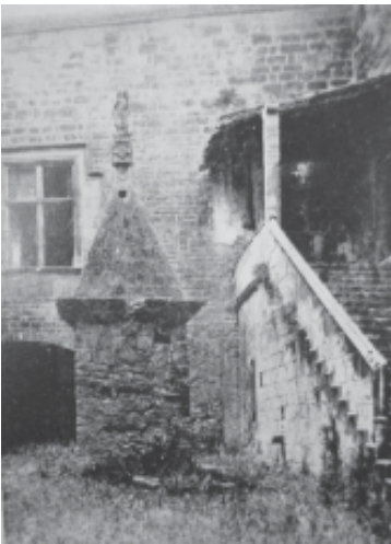
Vista del pati del castell de Solivella entorn l'any 1880.

Dibuix que es troba inserit dins de l'anomenat «Quaderns d'Apunts de Catalunya i Aragó». En el llibre Els castells Catalans trobem la següent descripció sobre el pati: «[...] En entrar, es troba un pati quadrat, al mig del qual hi ha la cisterna. És un monument de pedra piramidal, encimerat per l'estàtua de Sant Jordi amb el drac vençut. En la peanya, dos àngels esculpits, sostenint les armes nobiliàries dels Llorac [...]» (p. 360) (fig. 5).