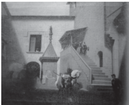
Vista del pati del castell de Solivella

Lorenzale l'exposà l'any 1849 a l'Exposició anual que organitzava l'Associació d'Amics de les Belles Arts (Barcelona), tenia el núm. de catàleg 87 i constava com a « Interior del castillo de Solivella de Queralt ».