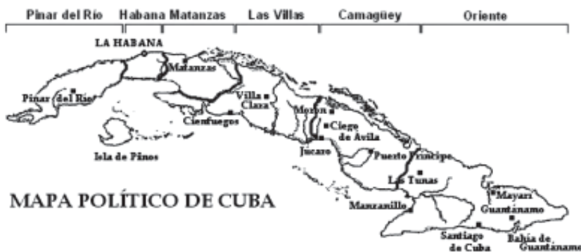
Mapa de l'illa de Cuba.

Caldrà esperar a l'any 1894, per documentar una nova insurrecció, primer a les Lajas, el 4 de novembre de 1893, i després a Ranchuelo, el 25 de gener de 1894. I així arribem fins al diumenge 24 de febrer de 1895, data definitiva de l'aixecament que acabarà amb la pèrdua de la colònia, aquesta jornada coincidia amb les festes de carnestoltes 2 ; de manera que el temps de reacció havia de ser teòricament més gran. A més, les autoritats illenques, estaven més pendents de les lluites polítiques entre els defensors de les reformes promulgades pel ministre Antonio Maura i els seus adversaris, que no pas dels preparatius que eren un secret a crits.