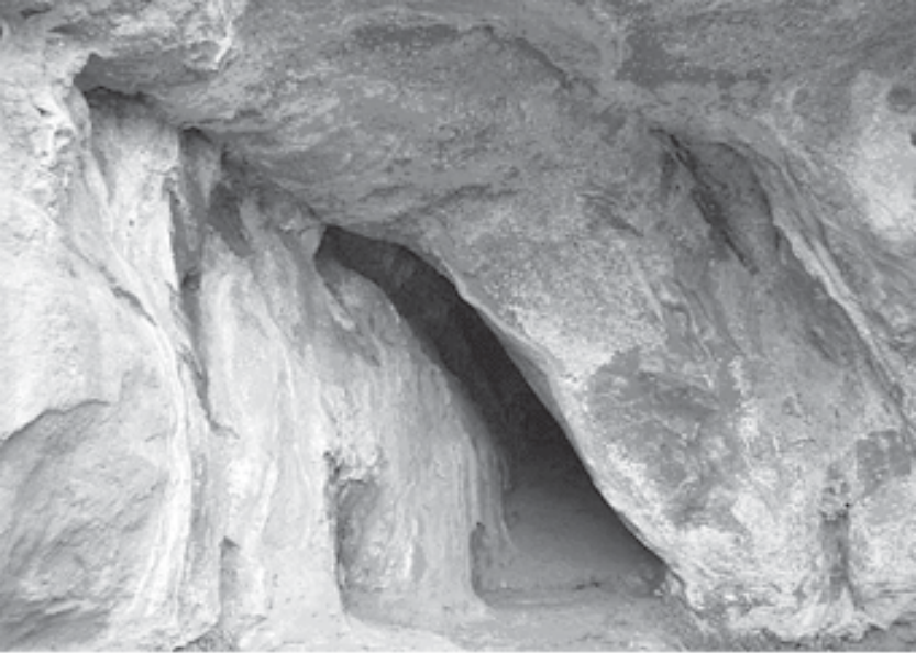
Ermita de sant Joan . Cova de Nialó. Lloc on popularment es diu que dormia Elionor

tinència de manera continuada, vestida amb robes aspres, tenia ajustada la cintura amb un cèrcol de ferro, portava argolles a les cames i anava descalça. Per això, en poc temps va agafar fama de santedat. La pròpia reina Maria des de València li escriví una missiva amb data 20 d'abril de 1427, en la qual elogia la seva vida (Giménez Soler 1899: 283) amb aquestes paraules: