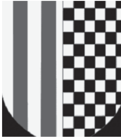
Escut d'armes de Jaume II

de Pere III el Cerimoniós i el seu besavi fou Alfons III el Benigne, a la vegada era cosina segona de Ferran d'Antequera (Ferran I), el seu enemic mortal.