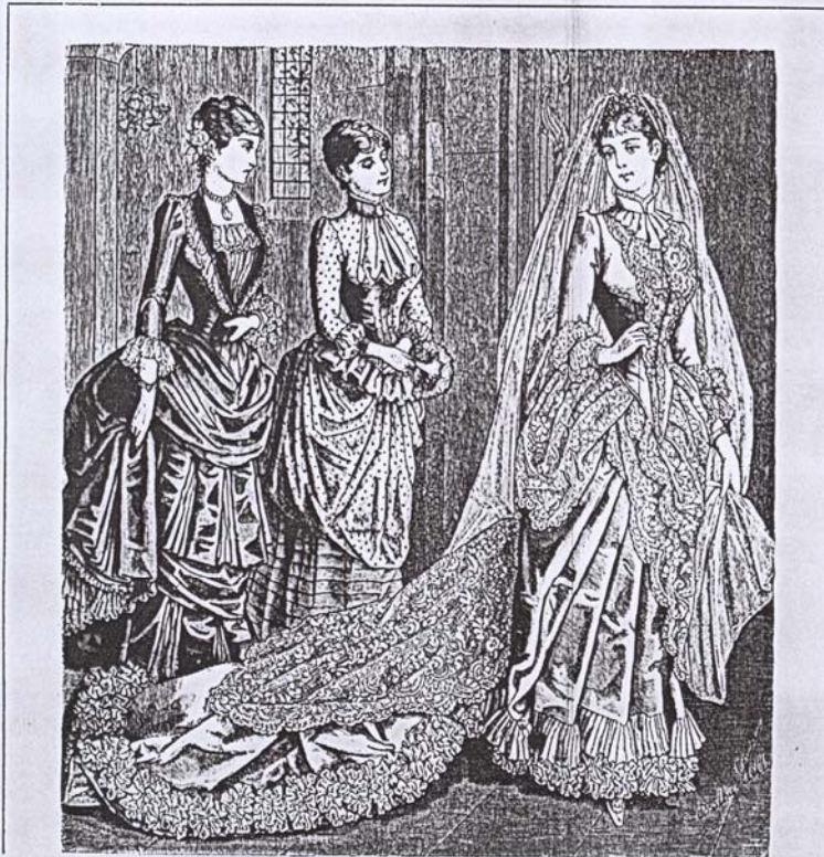
142.—Trajes de desposada y de ceremonia.

Correspondiente al núm. 24 de «La Ilustración de la Mujer» Barcelona 15 de Mayo de 1884.