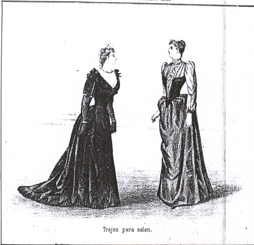
Trajes para salon.