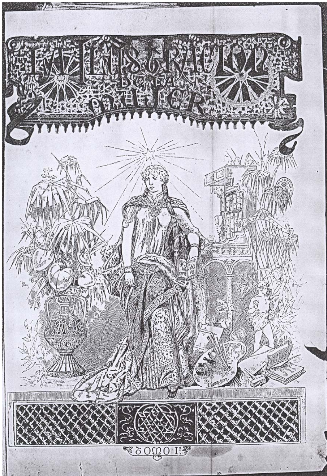
Fig. 3.- La Ilustración de la mujer . Barcelona. 1883.