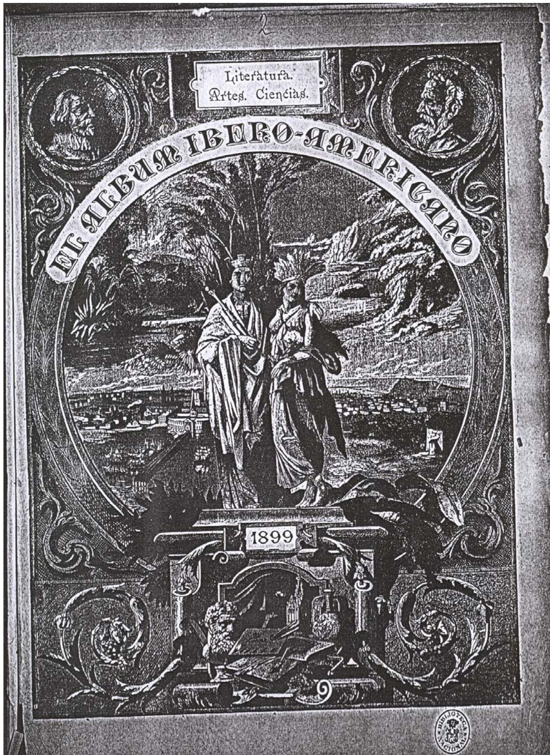
Fig. 7.- El Álbum Ibero Americano . Madrid. 1883.