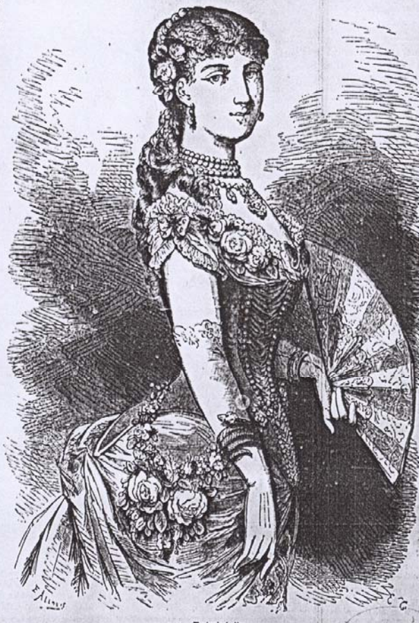
1. Traje de baile.

EXPLICACION DE LOS GRABADOS Núm. 1. Traje de baile.—El modelo que se ve bajo este número á la izquierda. Escarpiña de tricel constante f.