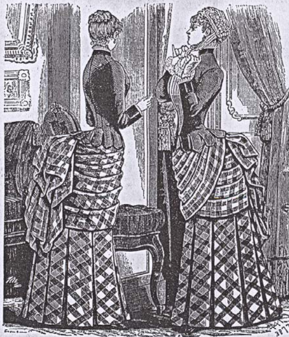
1-2.—Traje de visita y paseo.

tentes en la materia, en lo cual creemos cumplir como se debe con esta exigencia indelible de toda sociedad distinguida.