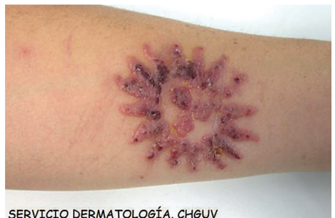
SERVICIO DERMATOLOGÍA. CHGUV

La henna es muy utilizada en países musulmanes e hindúes con fines cosméticos. Los tatuajes con henna son muy seguros y raramente producen reacciones adversas. Son excepcionales las reacciones de hipersensibilidad tanto aguda como retardada a este pigmento natural. Pero en occidente la henna es adulterada con aditivos para acelerar el secado, mejorar la definición y oscurecer su color rojizo. Uno de los aditivos más empleados es la parafenilendiamina (PPD) y el producto fruto de esta mezcla se conoce como henna negra. La sensibilización a PPD puede causar reacciones alérgicas graves y dejar secuelas estéticas permanentes (1, 6, 7) .