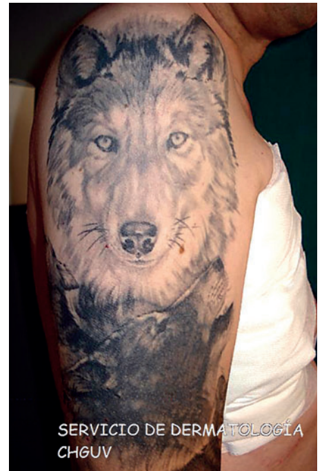
Foto 5: Intervención de ganglio centinela tras MM en paciente tatuado.

Se ha comprobado que la tinta del tatuaje, al ser insoluble, es fagocitada por los macrófagos y puede observarse en los ganglios linfáticos regionales. En los ganglios desarrolla una respuesta inflamatoria cuyos efectos secundarios