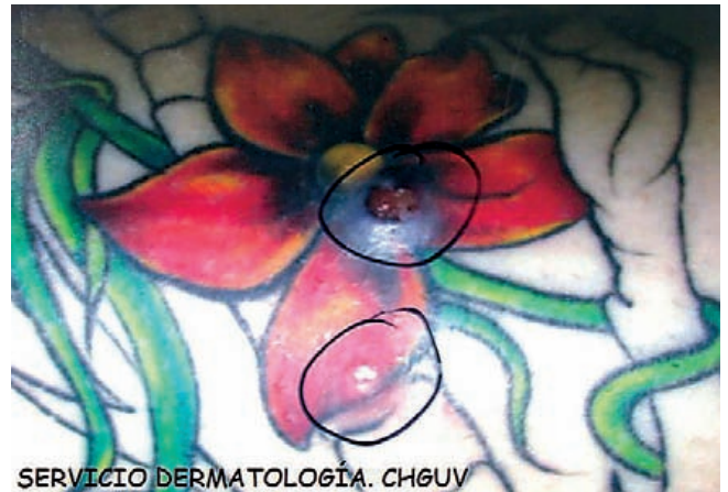
SERVICIO DERMATOLOGÍA. CHGUV

Dado el bajo número de casos y la gran prevalencia de personas tatuadas, hace pensar que esta asociación es casual. Lo que si debemos de considerar es que la aparición de un MM sobre un área tatuada ocasiona problemas de interpretación clínica e histológica (1,3) .