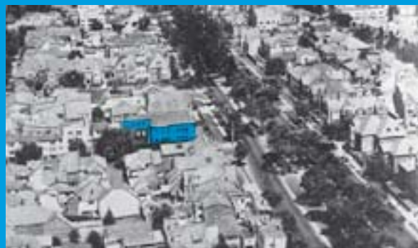
AVENIDA CARACAS EN DIFERENTES MOMENTOS HISTÓRICOS