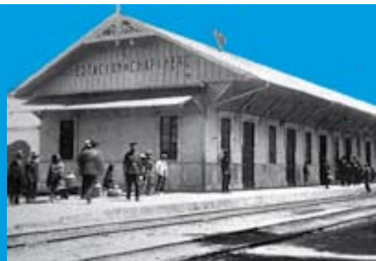
FOTO DE LA ESTACIÓN DEL FERROCARRIL DEL NORTE

Como un hecho lejano se toma la construcción del ferrocarril del norte, cuya línea pasaba cerca de San Diego donde se encontraba parte del Parque Centenario. Esta vía férrea es lo que corresponde hoy a la Avenida Caracas. Oficialmente, el Ferrocarril fue puesto al servicio en 1890 y comunicaba a Bogotá con Chapinero, para luego extenderse a los municipios del norte de la sabana. El 20 de julio del mismo año, se extendió la línea hasta el Puente del Común; el 6 de diciembre de 1986, hasta Cajicá y el 15 de abril de 1898, llegó a Zipaquirá (Museo de Desarrollo Urbano e Instituto Distrital de Cultura y Turismo, MDU-IDCT, 2002).