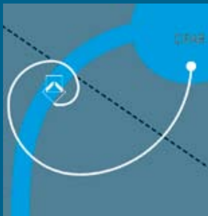
CENTRO DE INVESTIGACIONES FACULTAD DE ARQUITECTURA

SUSCRIPCIONES, ADQUISICIONES Y COMENTARIOS DIAG. 46A N° 15B-10 CUARTO PISO FACULTAD DE ARQUITECTURA - CENTRO DE INVESTIGACIONES CIFAR 3277300 EXT 3109 - 5146 cifar@ucatolica.edu.co ediciones@ucatolica.edu.co www.ucatolica.edu.co