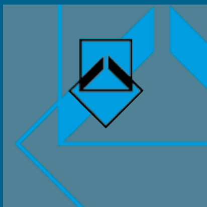
FACULTAD DE ARQUITECTURA