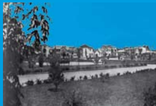
BARRIO PALERMO. Brunner, (1939)