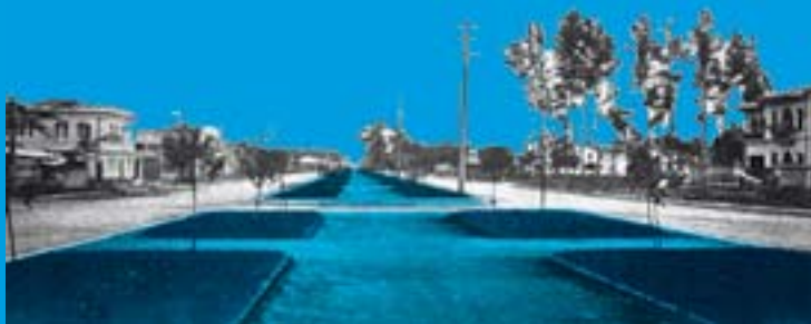
AVENIDA CARACAS, BOGOTÁ, 1934 Museo de arte moderno de Bogotá & Departamento de Arquitectura, (1989)

Por otro lado, es posible asegurar que en la arquitectura colombiana hay una deliberada intención de importar estilos europeos en el diseño y construcción de las viviendas de los sectores de elite. El estilo inglés gozó de un alto prestigio entre los arquitectos y sectores socialmente dominantes de la urbe bogotana –en expansión a mediados de la década del treinta del siglo XX. Elementos estilísticos que recuerdan la arquitectura victoriana: la ventana de bahía, el ladrillo a la vista, los techos inclinados. En definitiva, el norte de la ciudad permitió la construcción de lujosos chalets, donde parecía no vivir nadie