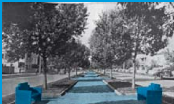
AVENIDA CARACAS 1935 Hofer, A. (2003), p. 149