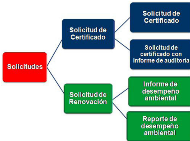
Figura No. 1 Procedimiento para obtención de certificado ambiental