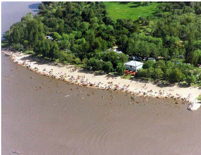
Figura 3. Vista aérea del Balneario Puerta del Sol