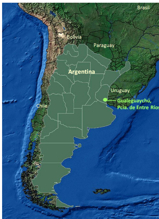
Figura 1. Ubicación de Gualeguaychú, Pcia. de Entre Ríos, Argentina

Este destino turístico, ubicado a orillas del río del mismo nombre, posee un paisaje litoral único y cuenta con innumerables atractivos, algunos relacionados con la vida en la naturaleza, balnearios y playas. Asimismo, tiene recursos basados en las tradiciones locales, tales como el muy consolidado "Carnaval del País". En los últimos años se ha enfocado también al turismo de salud, debido al descubrimiento de aguas termales y a la apertura de dos centros que brindan servicios específicos sobre la base de este recurso.