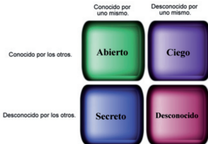
Figura 1. Ventana de Johari