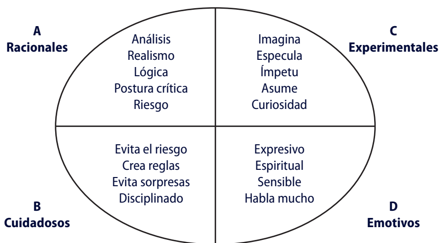
Esquema 1. Modelo de Ned Herrmann