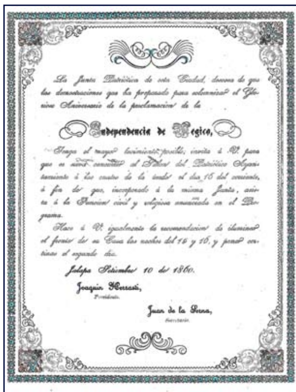
Figura 3. Invitación para la solemnidad del 16 de septiembre de 1860.