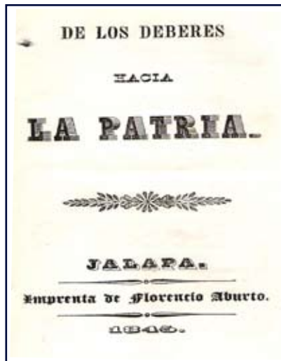
Figuras 4 y 5. Portada y contenido “De los deberes hacia la Patria”.

que hemos tenido el dolor de ver sucederse en la república en el periodo de dieciséis años. (AHMX, MI, José María Mata, 1845, caja 3, año 1843, p. 1, exp. 10). Estas élites políticas, que se pueden considerar muy reducidas, eran las que planeaban los proyectos educativos locales, basados en influencia de la Ilustración, pero determinados por sus necesidades apremiantes.