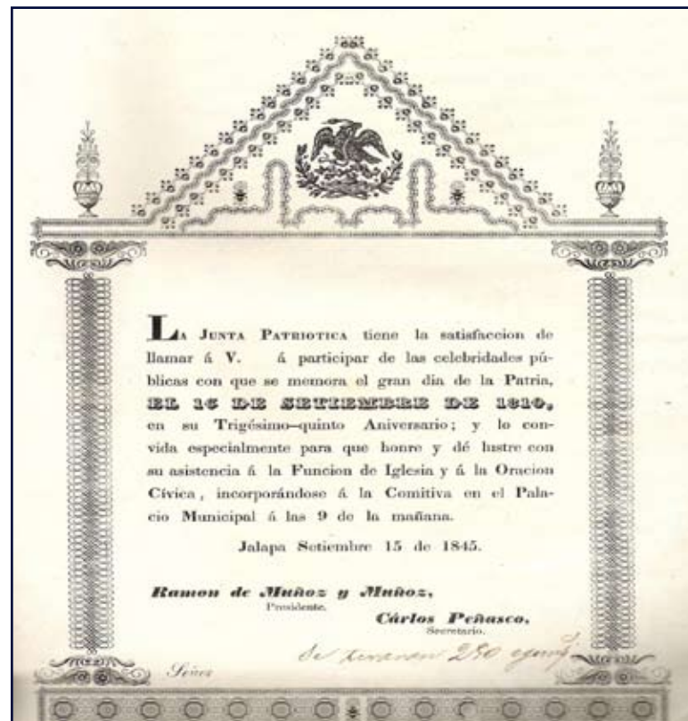
Figura 2. Invitación para la solemnidad del 16 de septiembre de 1845.