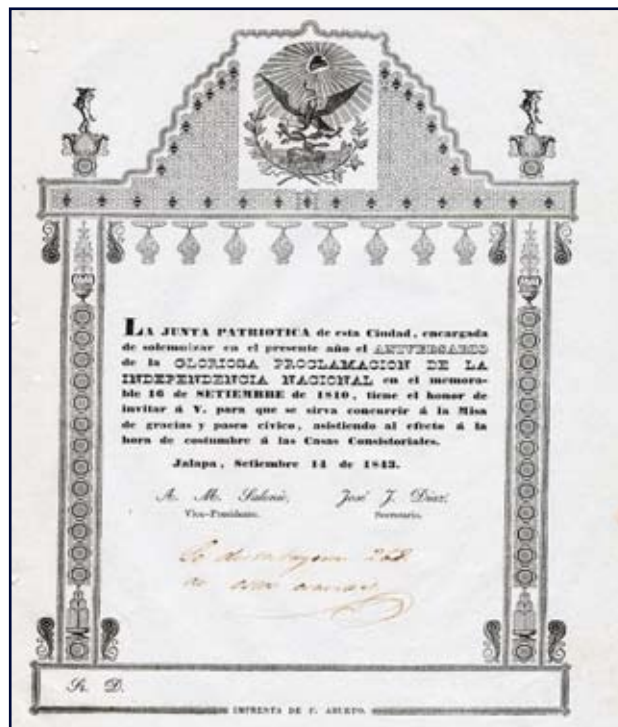
Figura 1. Invitación para la solemnidad del 16 de septiembre de 1843.

Fuente: AHMX, MI, caja 2, año 1843, p. 1, exp. 6, f. 19.