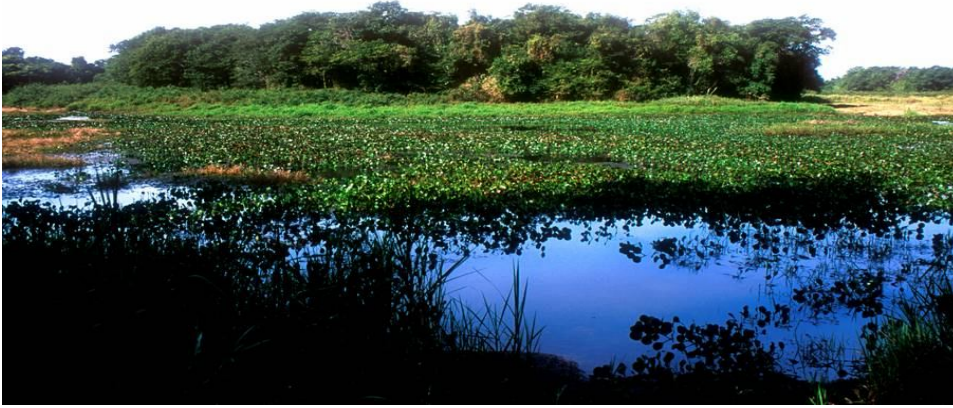
FIGURA 2. Lagoa do Diogo, Estação Ecológica de Jataí, Luís Antônio, SP.

do domínio da Fazenda Pública do Estado, no município de Luís Antônio, região centro-leste do Estado de São Paulo (Figura 3) (TANIGUCHI et al., 2004).