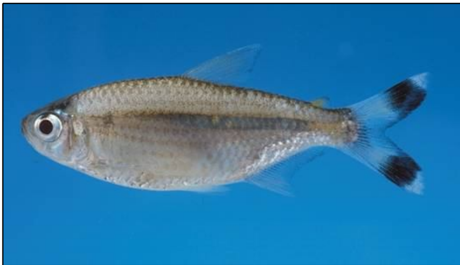
FIGURA 1. Moenkhausia intermedia (EIGENMANN, 1908).

A espécie Moenkhausia intermedia (Characiformes: Characidae) (Figura 1), é considerada de pequeno porte com até 8 cm de comprimento (FISHBASE, 2008) e um importante componente da cadeia alimentar, especialmente para outras espécies de peixes, de aves e de outros carnívoros que vivem na planície de inundação (LIZAMA; AMBRÓSIO, 2003). É conhecida como viuvinha no Estado de São Paulo e como pequi, piqui na planície de inundação do Alto rio Paraná (LIZAMA; AMBRÓSIO, 2003). É distribuída no rio Amazonas, rio Paraguai, rio Tietê, Bolívia e Guianas (FOWLER, 1948). Trata-se de uma espécie forrageira, considerada onívora e que pode ser encontrada em ambientes lênticos ou em lóticos (ESTEVES; GALETTI, 1994; LIZAMA; AMBRÓSIO, 1997)