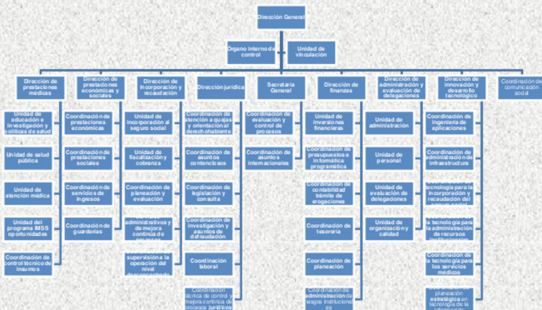
Figura 1. Estructura general y organizacional del IMSS Instituto Mexicano del Seguro Social, Nacional.

Por su parte, el Artículo 2 de la Ley del Seguro Social (LSS) establece que la seguridad social tienen por finalidad garantizar el derecho a la salud, la asistencia médica, la protección de los medios de subsistencia y los servicios sociales necesarios para el bienestar individual y colectivo, así como el otorgamiento de una pensión que, en su caso y previo cumplimiento de los requisitos legales, será garantizada por el Estado. En este sentido, el Instituto proporciona a sus derechohabientes una gama de seguros que permita cumplir con lo establecido en la Ley y sobre todo brindar tranquilidad y estabilidad a los trabajadores y sus familias ante el acaecimiento de cualquiera de los riesgos especificados en la LSS. El Seguro Social comprende el Régimen Obligatorio y el Régimen Voluntario. Los esquemas de prestaciones, requisitos y contribuciones para tener acceso a estos regímenes son diferentes en cada caso y están claramente establecidos en la LSS.