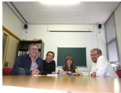
Profesores e investigadora en una sesión del grupo de discusión

compromisos en los que los profesores, los alumnos y la investigadora se comprometen y asumen sus responsabilidades en este proyecto, se ha creado un libro de participantes y se ha planteado un modelo de acta, ya que cada reunión además de contar con la transcripción escrita de las intervenciones, dispone de una acta en la que se describe la sesión y se señalan los acuerdos a los que se ha llegado. Esta técnica se ha utilizado para recoger