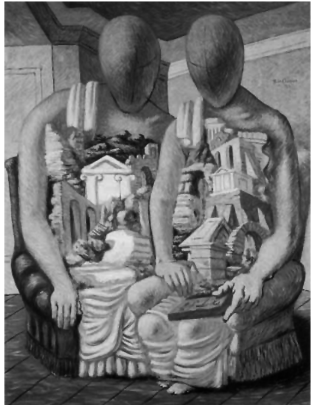
1926-1927. Giorgio De Chirico. Gli Archeologi .