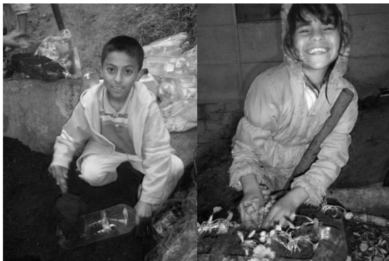
Figura 2: Reutilización de las botellas plásticas (niño de 11 años y niña de 9 años).

El diseño del sistema productivo hace referencia a los materiales utilizados, la profundidad del sustrato mínimo para el crecimiento de las plantas y la selección de las especies de plantas con uso alimenticio (Getter, Rowe, & Andresen, 2007). En este caso, se hizo naturalización indirecta, porque se usaron contenedores, como lo fueron las botellas plásticas de PET (Tereftalato de polietileno) usualmente fabricadas para envasar gaseosa y luego desechadas por sus consumidores (véase Figura 2); estas fueron más asequibles en precio y manejo (C. Berndtsson, 2010) puesto que, integrantes de las familias participantes tienen como ocupación el reciclaje. Las familias participantes identificaron una ventaja en la recolección de aguas lluvias, ya que ellos no cuentan con sistemas de alcantarillado, ni acueducto (comentario realizado por Yubely Roa, en San José del Guaviare).