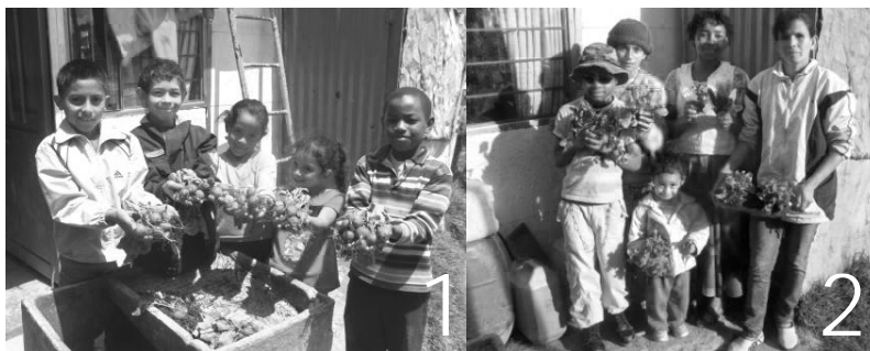
Figura 7: Familias participantes con su primera cosecha 1. Niños participantes. 2. Representantes de familia.