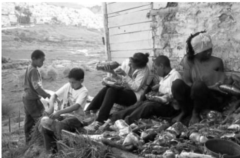
Figura 3: Siembra e instalación del sistema de cubiertas verdes (adultos, jóvenes y niños participantes).