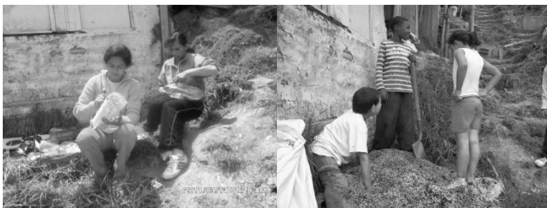
Figura 4: Adecuación de las botellas plásticas y mezcla del sustrato (mujeres representantes de la familia y sus hijos).