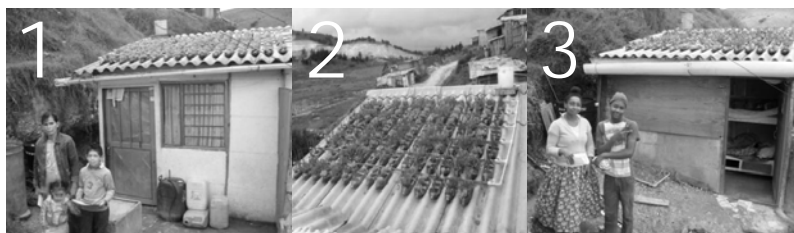
Figura 6: Sistemas actuales de ecotechos con recolección de aguas lluvias, utilizadas para el riego y las actividades domésticas, 1) tratamiento 1, 2) tratamiento 2, y 3) tratamiento 3. (2011).

El resultado final práctico obtenido (véase Figura 6) fue diferente para las tres viviendas por el tipo de vegetación, aunque la geometría de la edificación sea igual (Li, J., Wai, Li, Y., Zhan, Ho, & Lam, 2010).