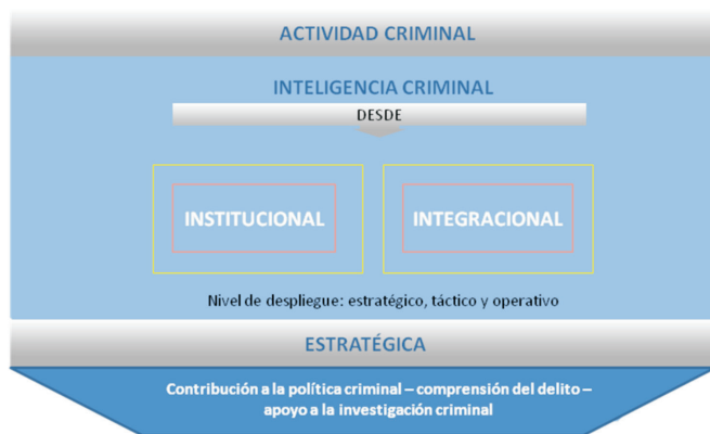
Gráfico 3. Modelo de inteligencia criminal propuesto

Desde hace medio siglo la DIJIN consolida la estadística contravencional y criminal, siendo éste el primer paso del análisis criminológico para conocer sus variaciones y fluctuaciones; por tanto, es necesario fortalecerlo, en especial, si se tiene en cuenta que la actividad criminal, como fenómeno social, se encuentra en transformación constante, hecho que obliga a utilizar herramientas a la par con los factores generadores y facilitadores del delito, lo cual a su vez, permite abordarlo desde perspectivas diferentes y estimular la corresponsabilidad autoridades-comunidad en la búsqueda de verdaderas soluciones.