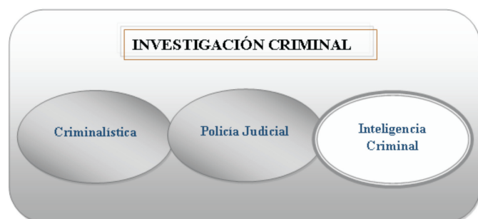
Cuadro 6. Componentes propuestos

La inteligencia criminal en la Institución atiende a las siguientes consideraciones: