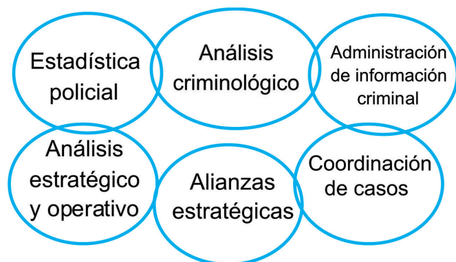
Gráfico 4. Procesos propuestos

- Estadística policial. Orientado a recolectar y procesar las estadísticas delictivas y contravencionales de manera técnica.