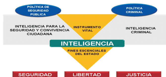
Gráfico 2. Concepción de inteligencia criminal

La inteligencia criminal se despliega dentro de los organismos de investigación criminal que aprovechan la información acumulada por ellos; en este sentido, la DIJIN junto con los grupos que cumplen actividades de investigación criminal adscritos a las Direcciones: Policía Fiscal y Aduanera, Tránsito y Transporte, Antisecuestro y Antiextorsión, Carabineros y Antinarcóticos son las avocadas a fortalecer lo que Gran Bretaña ha llamado “la nueva inteligencia para entender el crimen organizado” (Tim J. y Maguire M., 2004).