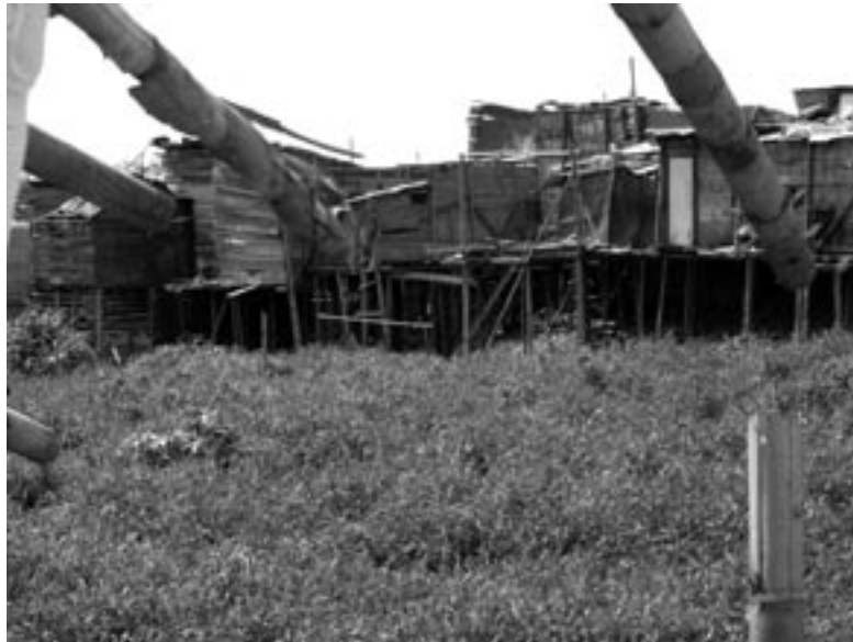
Barrio el Calvario, a la composición poblacional de Cali.

La correspondencia entre cosas y palabras, demuestra la coherencia, no sólo de un discurso, sino de una acción y de una decisión y, en todo caso, del individuo, grupo o sociedad en las dinámicas de transformación de su propia realidad. La coherencia es uno de los aportes más significativos al desarrollo como proceso de generación de oportunidades mediante las cuales, tanto los individuos como los grupos, vamos encontrando el lugar que nos corresponde en la colectividad, aportando nuestras palabras, nuestras cosas y nuestro imaginario conformado de la interacción entre unas y otras. Intuyo que a algo parecido se refieren nuestras comunidades indígenas cuando otorgan enorme valor al hecho de caminar la palabra . 3