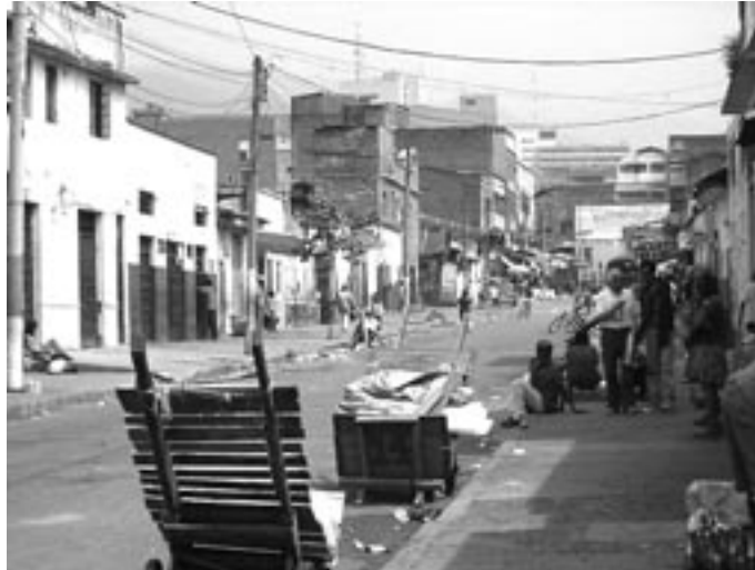
Barrio el Calvario, a la composición poblacional de Cali.

razones de orden moral, publicitario o cultural que aquí no alcanzaré a tratar.