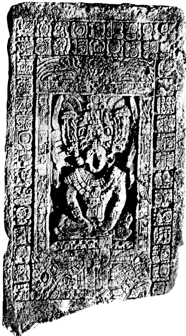
Figura 1. Estela 25 de Piedras Negras; tomado de Maler, "Researches in the Central Portions of the Usumacinta Valley, lámina 22.