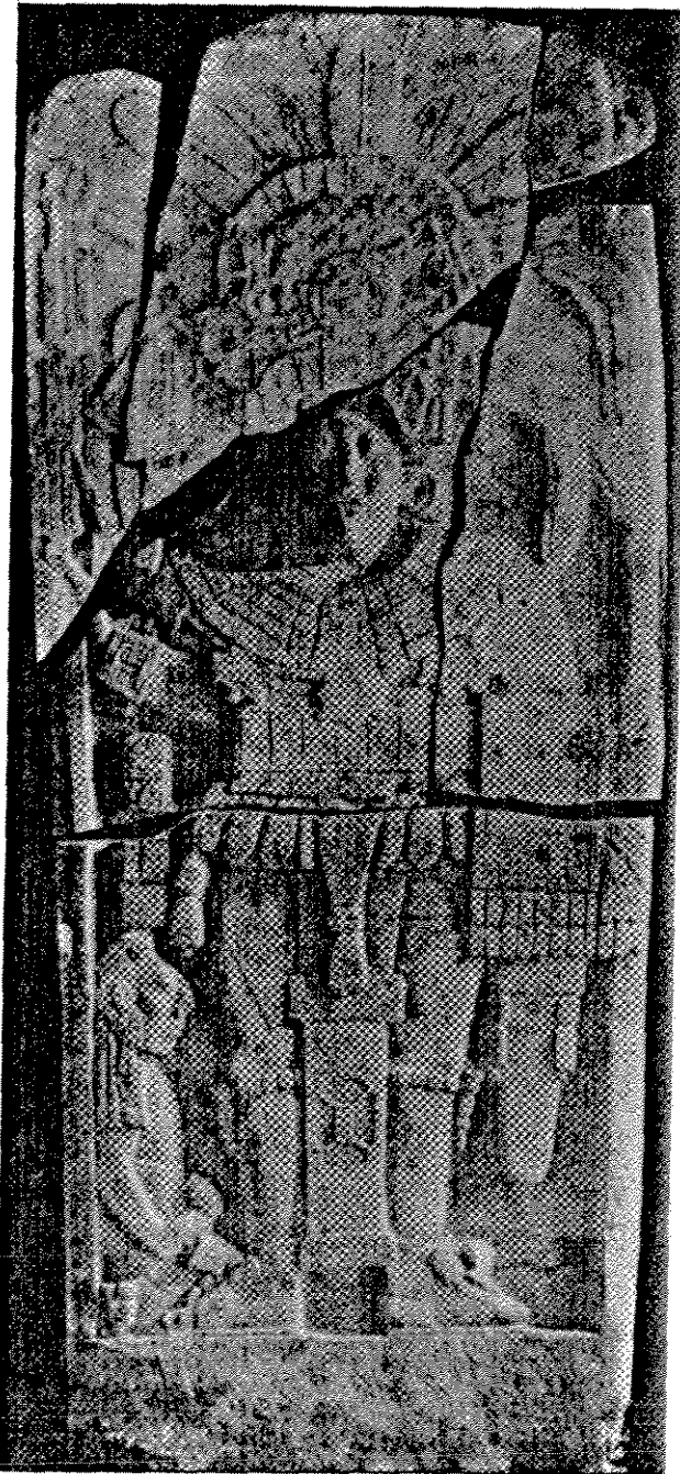
Figura 3. Estela 35 de Piedras Negras; tomado de Maler, "Researches in the Central Portions of the Usumacinta Valley", lámina 28.