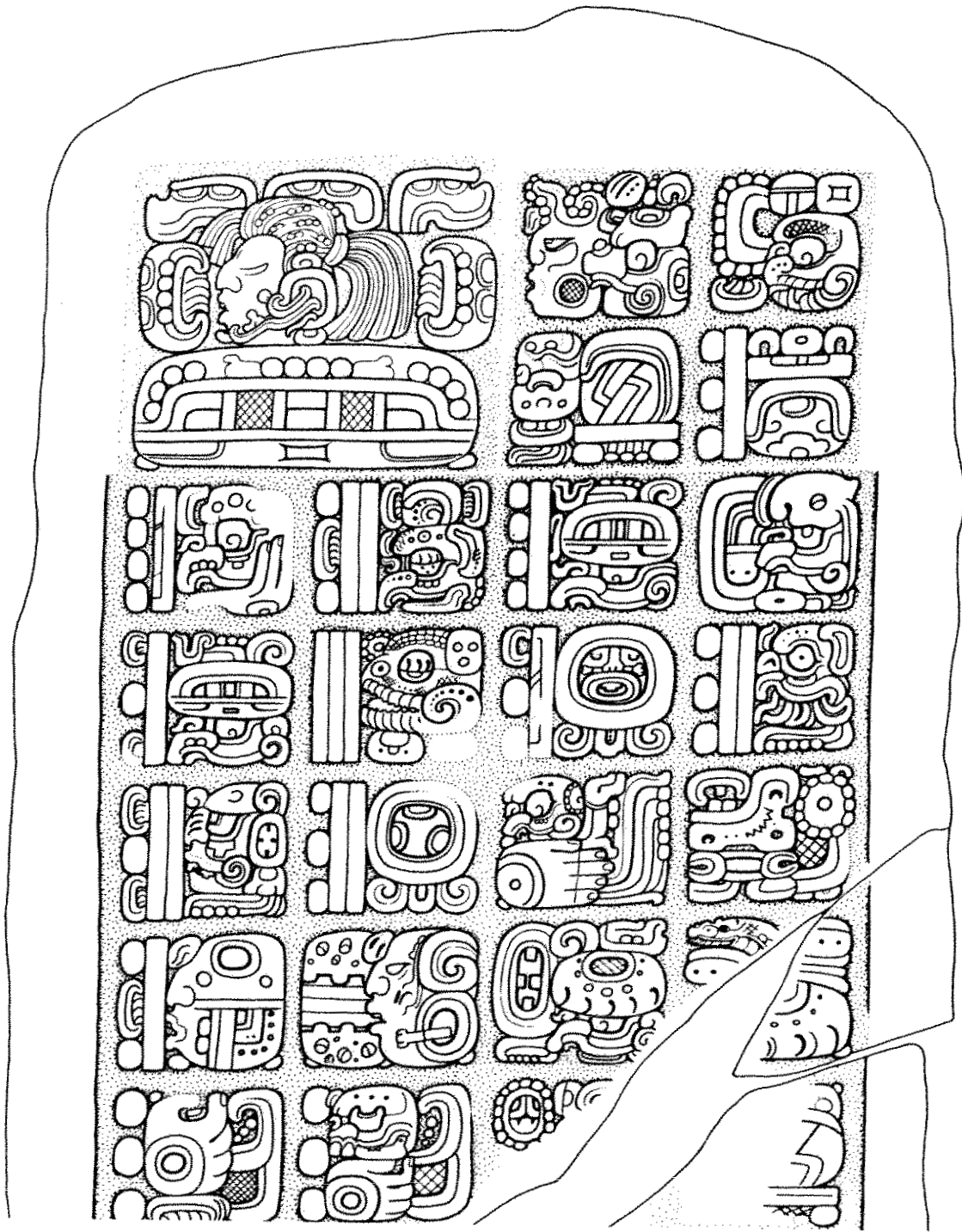
Figura 4. Estela 8, Dos Pilas; dibujo hecho en el sitio por Ian Graham.