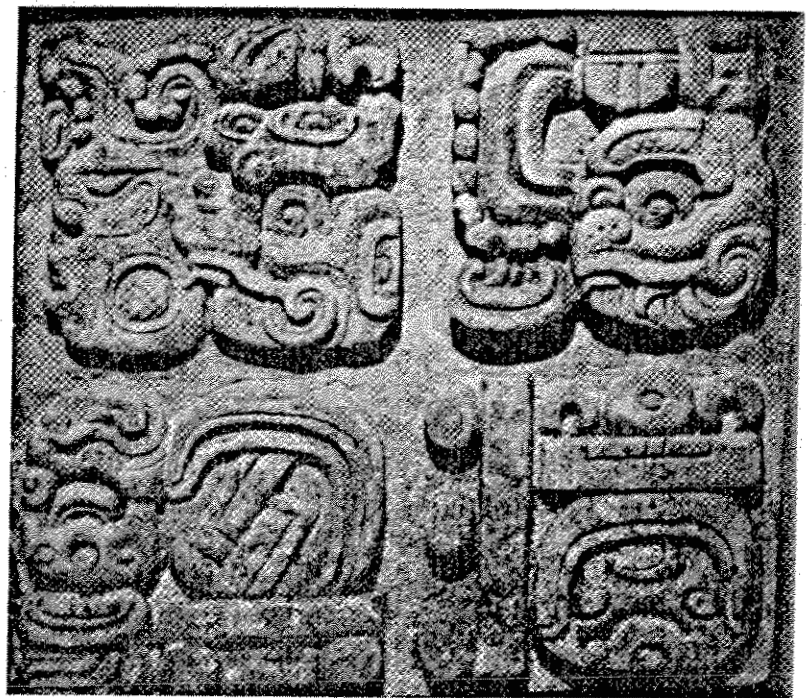
Figura 5. Ilustraciones descritas como "carved glyph panel" en el catálogo de la exhibición de las galerías Emmerich y Perls; (a) corresponde a la parte superior izquierda del dibujo de Graham, y (b) a la parte superior derecha.