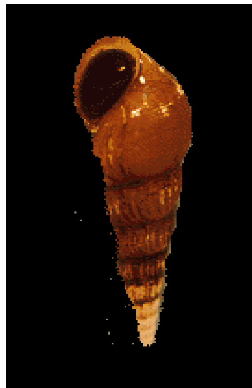
Figura 2. Morfotipo de M. tuberculata del área de Cieneguilla, Lurín, Lima, Perú. 3X.