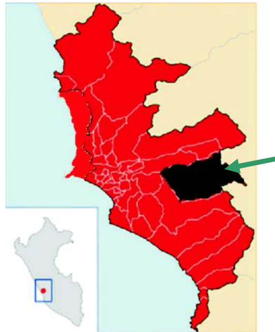
Figura 1. Ubicación del área de colecta (Flecha).

En cuanto a la relación parasitismo y presencia de machos, Ben-Ami & Heller (2008) postulan que a mayor población de caracoles, un mayor parasitismo y una mayor posibilidad de reproducción sexual (Hipótesis de la Reina Roja o Red Queen hypothesis). Sin embargo, los resultados de estos autores no son concluyentes. Contrariamente no encontramos relación entre el porcentaje de presencia de machos y la prevalencia del parasitismo en M. tuberculata (factor biótico). Sin embargo, ningún macho estuvo parasitado.