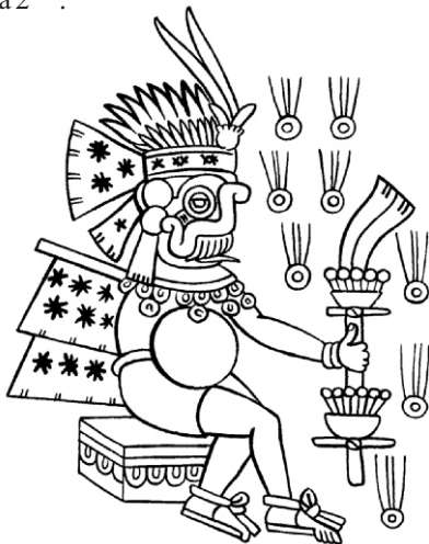
FIGURA 2. Tlaloc, dios de la lluvia y el relámpago entre los aztecas, se lo distingue por sus ojos saltones y sus dientes de jaguar. Se le relacionaba con el edema y la ascitis; asimismo, se creía que los ahogados y los fulminados por el rayo iban al primer cielo inferior, al Tlalocan, la morada de Tlaloc.

El tipo de dioses "ofendidos" influía en la clase de dolencia, por ejemplo a Tlaloc ("dios del agua") se le relacionaba con el edema y la ascitis; asimismo, se creía que los ahogados y los fulminados por el rayo iban al primer cielo inferior, al Tlalocan, la morada de Tlaloc. Ver Figura 2 10,11 .