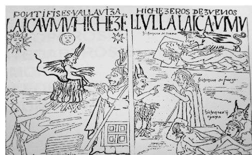
FIGURA 5. Los andinos prehispánicos también relacionaban sus enfermedades con la maledicencia de los brujos (Laikas) incitados por sus enemigos; Guamán Poma de Ayala ha descrito con detalle las prácticas de estos "hechiceros". Dibujos de Guamán Poma de Ayala (siglo XVI).

Los andinos prehispánicos también relacionaban sus enfermedades con la maledicencia de los brujos (Laikas) (Ver Figura 5) incitados por sus enemigos; las lesiones hipocrómicas de la piel (Khara), anorexia, caquexia y la impotencia sexual eran atribuidas a estos sujetos. Guamán Poma de Ayala ha descrito con detalle estas prácticas de los hechiceros que hacían daño utilizando sustancias tóxicas o ponzoñosas.