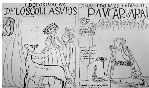
FIGURA 1. La teología prehispánica era panteísta y politeísta, asumía la espiritualidad del medio natural circundante; en ese contexto, vinculaban los cataclismos y las enfermedades con el poder de sus "apus". Dibujos de Guamán Poma de Ayala (siglo XVI).

La magia apareció simultánea al deseo de influir sobre los fenómenos sobrenaturales, con el correr del tiempo se insertó en un sistema animista. La teología prehispánica era panteísta y politeísta, asumía la espiritualidad del medio natural circundante; en ese contexto, vinculaban los cataclismos y las enfermedades con el poder de sus "apus". Ver Figura 1.