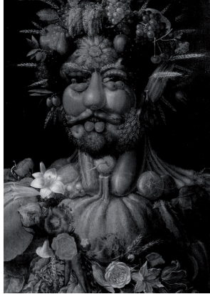
Gráfico A. El Vertumno de Giuseppe Arcimboldo (1590).

Gracias a la labor creadora de Niimúe, el principal ser viviente, quien creó el mundo primigenio a partir de su propio cuerpo, se materializó la totalidad del territorio indígena miraña como un gigantesco ser vivo constituido por las diversas plantas y especies animales primordiales; 3 composición que hace que muchas de estas especies adquieran una especial significación y se les maneje casi ritualmente durante su captación, recolección y preparación.