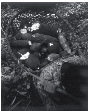
Foto 1. Recolección y almacenamiento de los frutos de la chagra. (Andrea Bora Miraña se dispone a cargar los bulbos de yuca brava recolectados en su canasto. Puerto Remanso-El Tigre, Rfo Caquetá, 1997, CSTM.)

Posteriormente, la mujer trasladará los alimentos hacia la cocina o “casa de la comida” (en miraña, /majchója`/), donde se dará a la tarea de rallar, lavar, colar y exprimir los tubérculos, así como de preparar lo necesario para cocer el pescado.