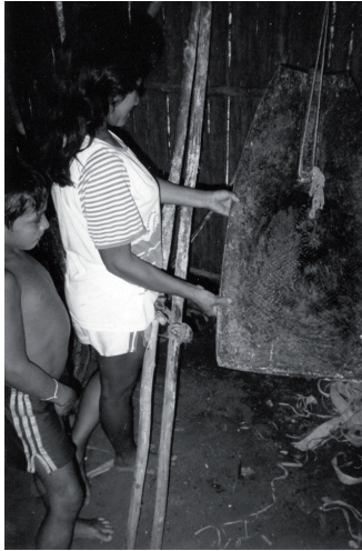
Foto J. Rallador de yuca tradicional. Actualmente se ha introducido el empleo de ralladores de metal; pero las abuelas recomiendan el empleo del artefacto tradicional. (Maloca de Santa Clara, de la etnia makuna, Río Apaporis-Vaupés, 1999, CSTM.)

manera que el agua, el jugo y el veneno de la yuca desciendan hacia una cerámica de dimensión considerable, donde con el paso de las horas se asentarán el almidón, el caldo o jugo de la yuca y el agua mezclada con parte del líquido venenoso (véase la foto κ).