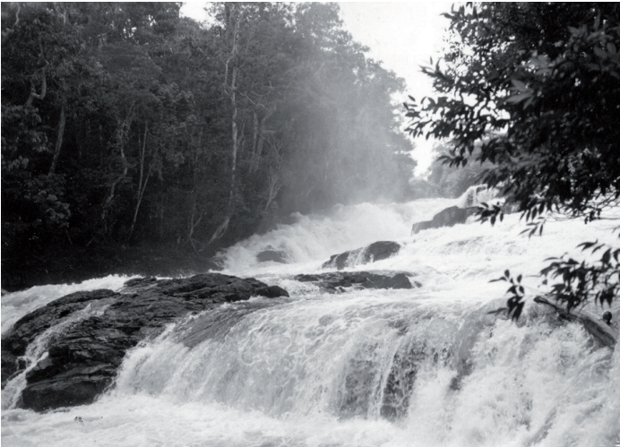
Foto B. Los chorros o pedregales ( /neéwayba/ ), constituyen los lugares por excelencia de abastecimiento de pescado, uno de las principales fuentes de alimentación de este grupo indígena (tomada en raudal quebrada de Metá ( /Bakoi/ ). Medio Río Caquetá. 1994, CSTM ).

La cocina y sus madres: una estrecha relación entre el mundo femenino y el saber culinario miraña