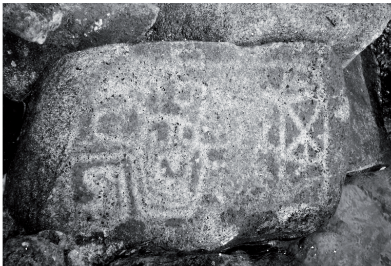
Foto A. Muchos de los petroglifos grabados en las rocas aledañas a chorros o raudales en el río Caquetá (en miraña /Okájimo/ o «río de la danta») hacen referencia a eventos míticos de gran importancia para los pueblos indígenas, entre los cuales se evidencia el empleo exclusivo de determinadas especies vegetales y animales por parte de la etnia, quienes las detentan en calidad de poseedores excepcionales de dichas especies y sus respectivas variedades (foto tomada en raudal de Araracuara. Medio Río Caquetá. 1994, CSTM).