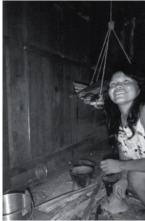
Foto F. “El fogón ( kíji’wa’ ), u ‘hogar de la candela’ (...), facilita la cocción y preparación de los alimentos, [y] constituye un espacio vital en torno al cual se transforma (procesa) todo aquello que es traído del río, el monte o la chagra.” (Mujer barasano preparando las astillas y las bases de su fogón para cocinar. Bocas del Pirá-Apaporis, 1999, CSTM.)

Por excelencia, son las esposas e hijas de los maloqueros (hombres a cargo de la maloca) las mejores proveedoras, cocineras y anfitrionas de las comunidades. Se dice que estas mujeres (comúnmente conocidas como maloqueras) han sido habilitadas (“curadas”) desde su nacimiento para ejercer laboriosamente su cargo, de tal manera que cada vez que tienen la tarea de hacer algo (rallar yuca, exprimir y sacar el almidón, preparar las carnes de monte, elaborar el ají negro, etcétera), lo hacen de una manera más que eficiente.