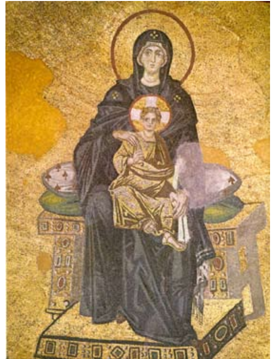
Figura nº 1 (arriba) Anónimo bizantino Virgen Hodegetria , h. 860 Mosaico con aplicaciones de oro. Hagia Sophia, Estambul.