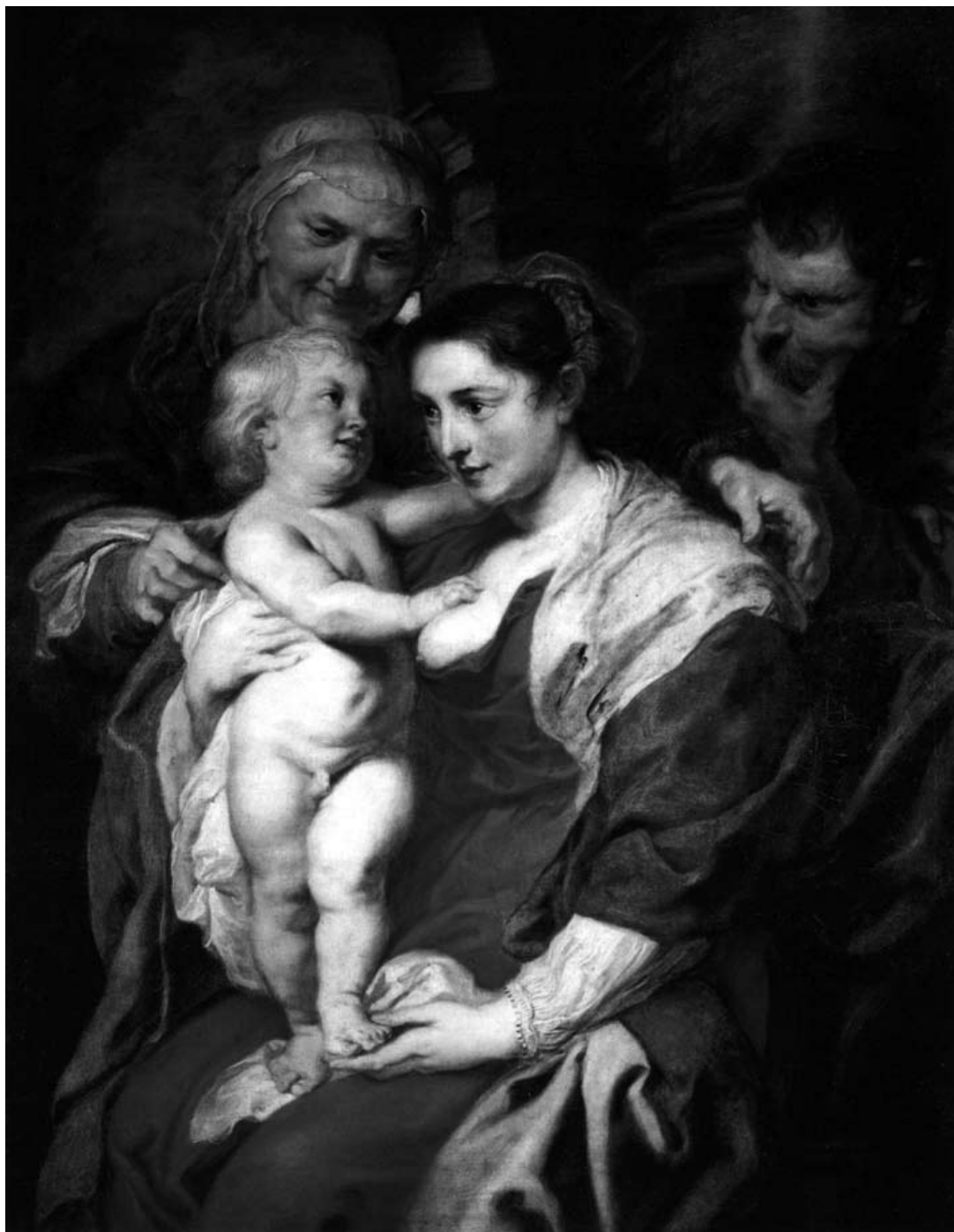
Figura nº 7 (abajo) Pietr Pawel Rubens La Sagrada Familia con Santa Ana , h.1630 Museo del Prado, Madrid.

Figura nº 6 (página opuesta, abajo) Alessandro Botticelli Madona del Libro , h.1483 Museo Poldi Pezzoli, Milán.