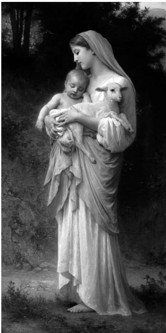
Figura nº 8 William Bogureau La Virgen de la inocencia , 1883 Colección Privada

Así pues, las obras de arte religioso cristiano en Occidente no reproducen en modo alguno la realidad, así como tampoco la presentan , aun a pesar de lo que las apariencias puedan decirnos. Estas obras representan , es decir, son representaciones y en ese sentido, interpretaciones de la realidad en un momento dado y bajo unas condiciones particulares. Comprender el alcance de esta definición y mantener clara la distancia que existe entre una reproducción de la realidad y una representación de ésta, es fundamental.