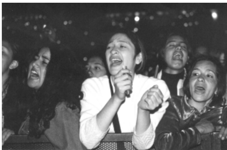
Noche de las mujeres, parque Simón Bolívar, Bogotá, Marzo 2003.

impacto del género en las políticas económicas (y de las políticas económicas sobre el género) no es accidental, sino estructural. Lo anterior cuestiona uno de los fundamentos de la economía neoclásica, el “individuo económico racional y egoísta, que si bien no tiene sexo ni género, clase ni raza, historia ni contexto geográfico,