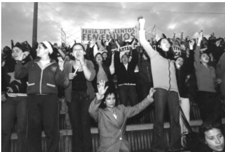
Día de la Mujer, Feria de Talentos Femeninos, parque Simón Bolívar, Bogotá, marzo 2003.

La iniciativa Presupuesto Municipal con Perspectiva de Género es parte del proyecto regional “Política Fiscal Pro-Equidad de Género en América Latina y el Caribe” 11 de la Cooperación Técnica Alemana, GTZ.