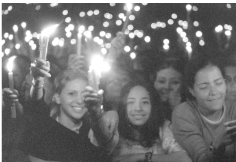
Noche de las mujeres.

Por otro lado, desde el eje de investigación se analizaron distintos programas gubernamentales de combate a la pobreza (Programa de Ampliación de Cobertura y “Progresá”), cruzando las variables clase y gé-