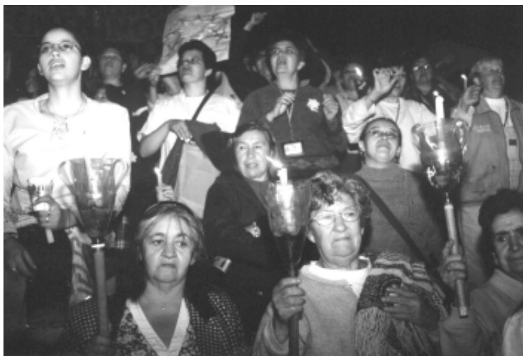
Noche de las mujeres, parque Simón Bolívar, Bogotá, Marzo 2003.

Los presupuestos sensibles al género forman parte de una serie de iniciativas que la sociedad civil y los gobiernos de diversos países han comenzado a instrumentar con los siguientes propósitos: determinar si el gasto público obstruye o promueve el desarrollo de oportunidades equitativas para hombres y mujeres, y si los compromisos gubernamentales con la equidad se traducen en compromisos monetarios; examinar la posibilidad de reorganizar las prioridades de los recursos públicos hacia patrones más equitativos y eficientes de recolección de ingresos y uso de recursos, con el objetivo de incentivar el desarrollo; y determinar cómo las asignaciones presupuestales afectan las oportunidades sociales y económicas de hombres y mujeres, mediante la desagregación del gasto público. Surgieron como respuesta a la necesidad de estrategias más efectivas para monitorear e impulsar la igualdad social y económica entre hombres y mujeres (Sharp, 2001: 46). No son presupuestos específicamente formulados para las mujeres, sino que se refieren al análisis desagregado por sexo de los presupuestos (tanto en su componente de gastos como en su componente de ingresos) mediante un lente de género. También se refieren a la elaboración misma de los presupuestos tomando en cuenta y valorando su impacto sobre la vida de los hombres y