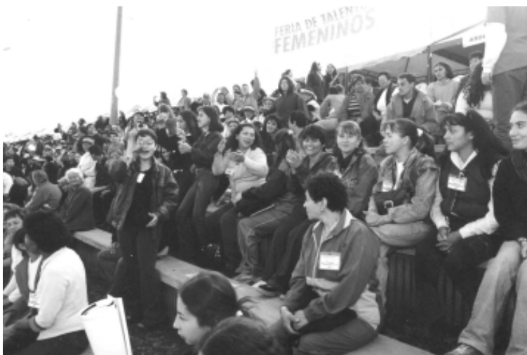
Día de la Mujer, Feria de Talentos Femeninos, parque Simón Bolívar, Bogotá, marzo 2003.

mujeres y analizar su asignación presupuestaria como proporción del gasto total de la dependencia o entidad a lo largo de varios años, para crear una serie de indicadores que pudieran medir el progreso de la equidad de género, la normatividad que rige la aplicación de los recursos y la medida en la que éstos influyen en las mujeres, bajo el siguiente esquema: