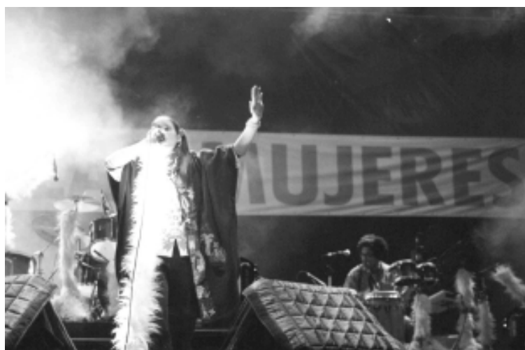
Concierto de Andrea Echeverri, Noche de las mujeres, parque Simón Bolívar, Bogotá.

El balance positivo de los resultados de esta primera iniciativa se refleja en el po-