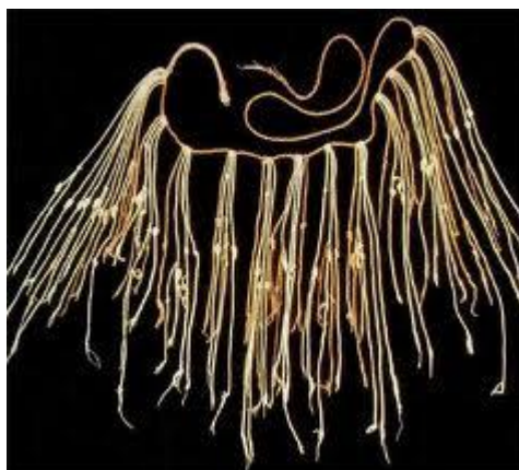
Figura 2. Fotografía de uno de los pocos ejemplares de quipus que aún subsisten.

Y volviendo a América del Sur, la civilización andina crea y organiza hacia el siglo XII de nuestra era el Imperio de los Inca. Es a partir de esa época, que aparece el célebre quipu , consistente en una cuerda de lana tejida (en posición horizontal), de la cual cuelgan cuerdas con nudos como instrumento para contar y llevar inventarios de alimentos, por ejemplo. Diferenciados por su lugar en la cuerda perpendicular y además distinguidos por colores de lana teñida, la nada ó el 0 se reconocía al dejar un espacio libre entre nudos. Ver Figura 2.