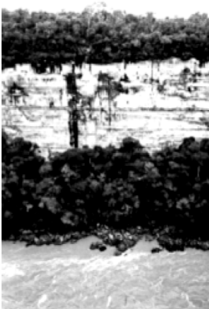
Cañón de Araracuara, río Caquetá, Cartilla 2001, Instituto Amazónico de Investigaciones.

y ganado son los productos que hacen fortuna a finales del XIX y comienzos del XX. Los colonizadores ayudan a aumentar los precios de la tierra, pues volvían útiles áreas “incultas”, abrían trochas, brechas y caminos. Los más beneficiados con esto eran los empresarios terri-