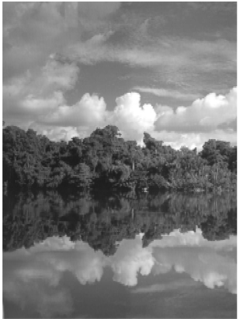
El río Miritiparaná nace cerca del río Apaporis y desemboca en el río Caquetá.

para comprobar los derechos de propiedad no estaban jurídicamente estipulados ¿Qué podían hacer los empresarios agrícolas si el viento estaba a su favor? Para solucionar esto, en 1926, la Corte Suprema de Justicia promulga que de esa fecha en adelante todo el territorio colombiano se presumiría baldío a menos que se demostrara lo contrario . La forma de demostrar lo contrario era con la presentación del título original con el cual el Estado había enajenado una determinada parte de extensión de tierra del dominio nacional, para darla en concesión. Ni los testamentos, ni las senten-