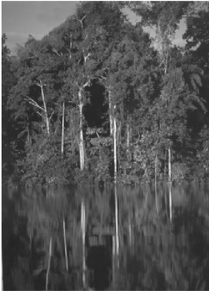
El intrincado laberinto de caños de la Amazonia colombiana. Colombia secreta, Villegas Editores.

Son las actitudes y representaciones de una colectividad particular con respecto a la naturaleza, la de la elite que se encarga de “dirigir” el destino del país y que repercute en todos los estratos, creando no solo políticas y técnicas sino también actitudes profundas.