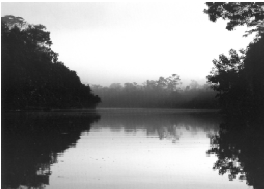
Caño de la Amazonia, entre los ríos Putumayo y Amazonas. Colombia secreta, Villegas Editores. Foto: Andrés Hurtado

actividades políticas de índole comunista con un presidio de uno a cinco años. Lo que quiero decir es que la idea que se tenía de naturaleza, campo, estructura agraria, era la de medio de producción y generador de riqueza para unos, y la de destierro para otros. La Ley 105 es “precisa pero ambigua”: es explícita en que su intención no es reeducar o reincorporar al sentenciado a la sociedad a través del trabajo productivo, como suele ser la intención de los trabajos impuestos a los “reos”, sino ejercer “pena corporal” a quienes lo merezcan, y al mismo tiempo, señala la adjudicación de las tierras al sentenciado, que estén en cultivo al momento de cumplir la pena.