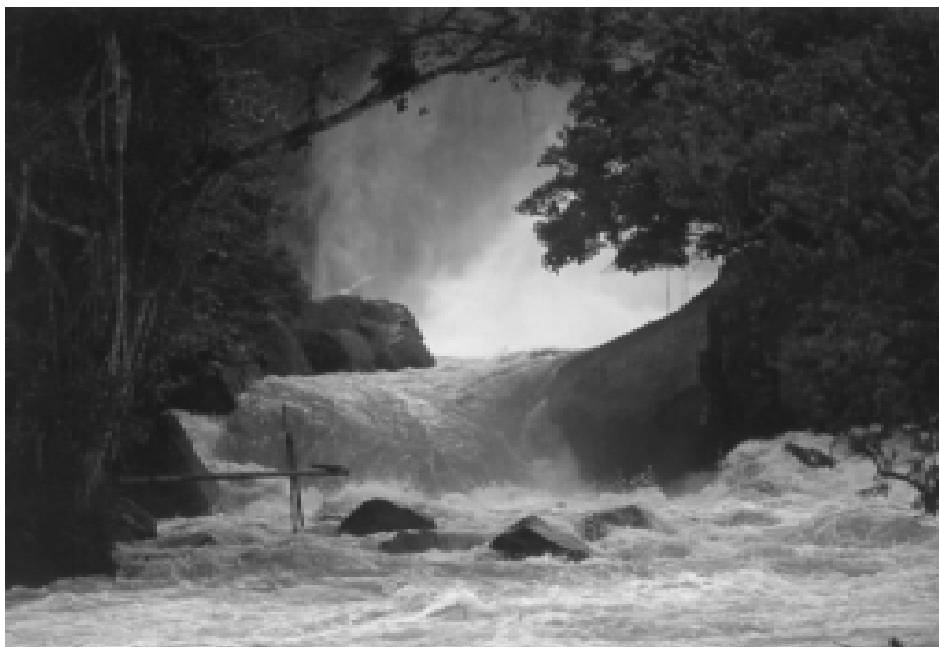
Desembocadura del cañón de Araracuara en el río Caquetá. Colombia secreta, Villegas Editores. Foto: Andrés Hurtado

gurosos, la tradición “hidalgas” exigía “ser cristianos viejos, limpios de toda raza, casta y generación de judíos conversos, gitanos y otra mala secta, que no han sido castigados por el Santo Oficio de la Inquisición por crimen de herejía, apostasía, judaísmo ni otro; que no han cometido delito de infamia de hecho ni de derecho, ni tenido oficios viles, bajos ni mecánicos por donde degeneren quienes son, antes bien, que siempre han vivido bajo la profesión de la santa fe católica” (Paz, 1987: 11). Para finales del siglo XIX, ya creada la Escuela de Ciencias Naturales de la Universidad Nacional, los estudios agrícolas no seducían a los que pretendían obtener un título universitario pues no habían alcanzado nivel científico ni social, ni proporcionaban movilidad social. Si miramos cincuenta años antes nos encontramos con una educación puramente filosófica, jurídica y humanística. La tierra proporcionaba estatus; poseerla, trabajarla, no. Era una actividad servil 3 . Esta