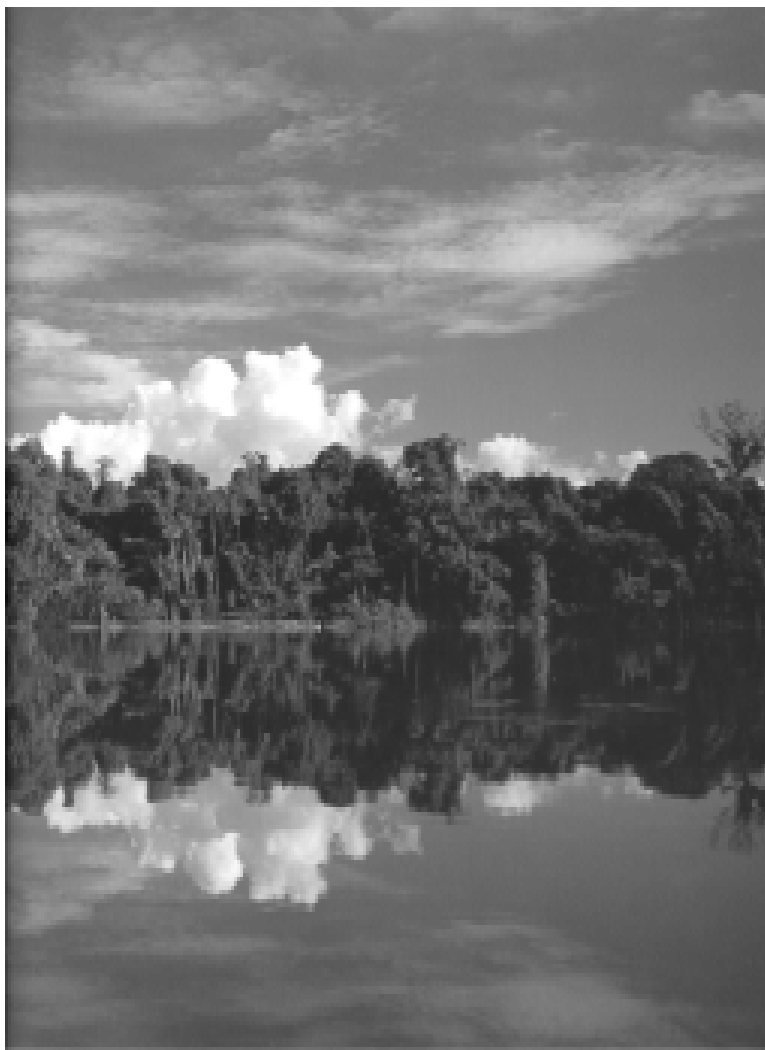
Amazonas. Colombia secreta, Villegas Editores.

Para completar este cuadro de imágenes, ideas y conceptos de la elite sobre la naturaleza durante la primera mitad del siglo XX, basta con seguir el devenir nominal del Ministerio de Agricultura, sus indefiniciones, denominaciones, fueros y adscripciones. En 1913, y por iniciativa de Rafael Uribe