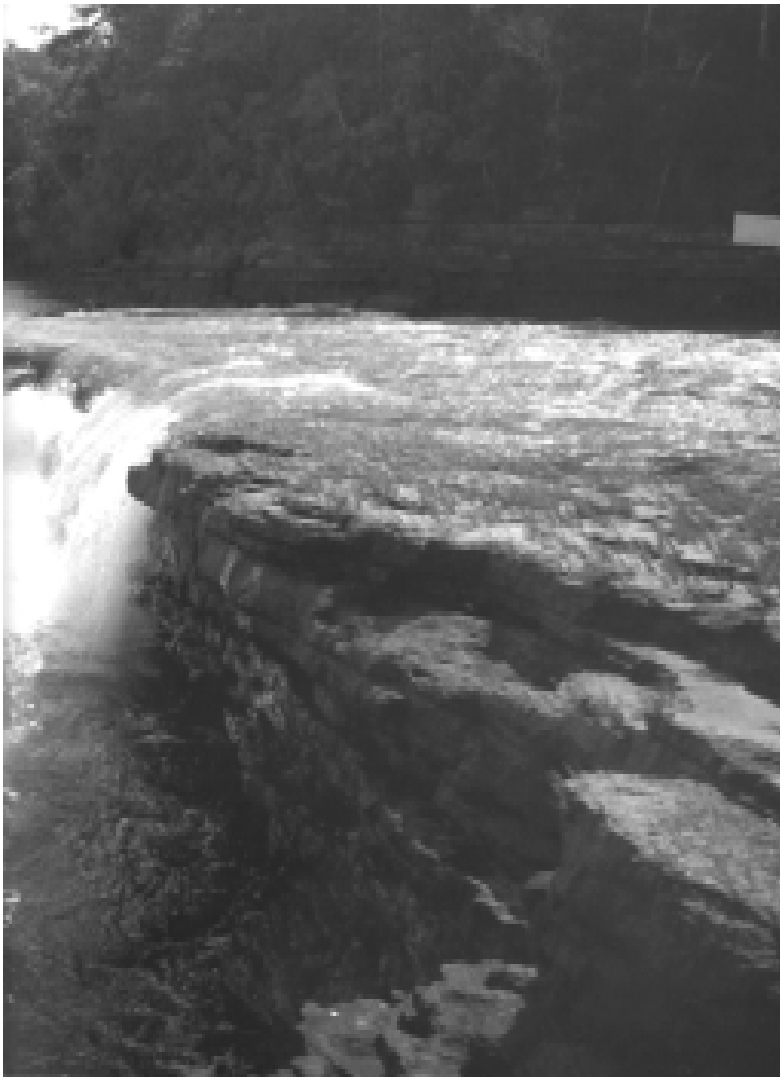
río Caquetá. Colombia secreta, Villegas Editores.

Pero las ideas sobre el determinismo geográfico ni nacen con Gómez ni mueren con él. Inmediatamente después, otro personaje de la política, Luis López de Mesa, plantea el determinismo en términos de “civilización de vertiente”. A partir de la segunda década del