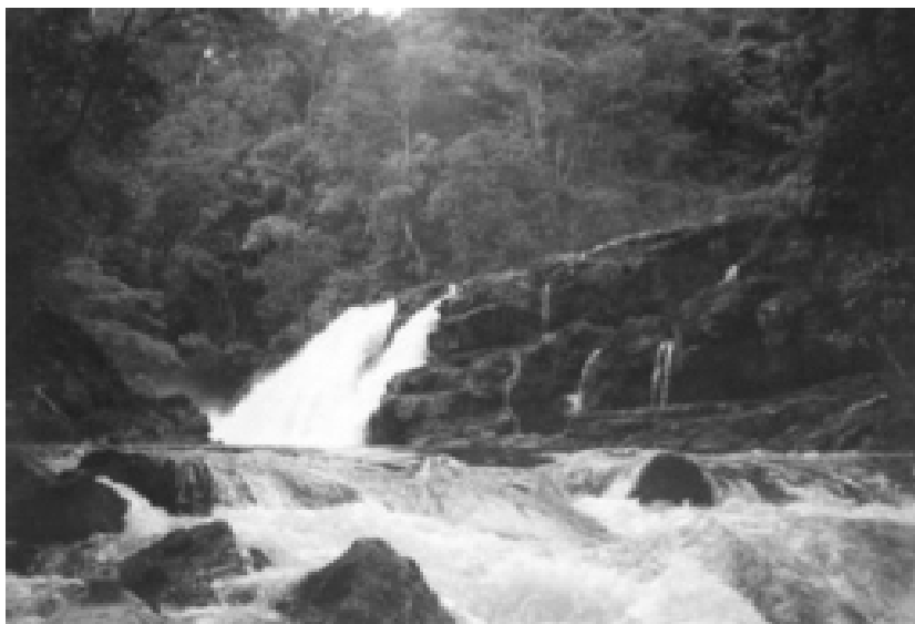
Quebrada del Sol, Caquetá, Amazonia colombiana. Cartilla 2001, Instituto Amazónico de Investigaciones

llevada a cabo por estos antioqueños, quienes por contrato, en cuadrillas y a destajo, descujaban las selvas y los montes y entregaban tierras sembradas en maíz primero, y en pastos para ganado después. Decía Montesquieu que “la esterilidad de un país hace a sus habitantes industriosos, trabajadores, sufridos, sobrios, valientes; [...] La fertilidad produce un efecto contrario: tienen con la abundancia, la desidia, la inactividad y más apego