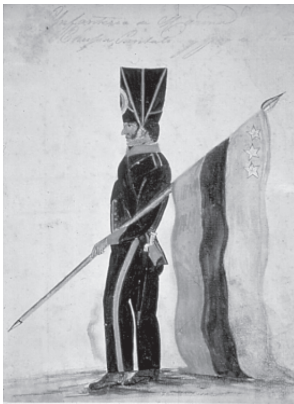
Aliriventz, Uniforme de Infantería de Marina, 1823, acuarela, 22 x 15,3 cm. Museo Nacional

Al final de este recorrido y de la insistencia en un conjunto de preguntas que exigen transformar nuestra comprensión de la política nos queda recalcar que tal proceso es inseparable de una discusión sobre nuestras “certezas morales”. Se trata de un viejo problema: “poco falta para que asimile las reglas de Descartes a este principio de aquel químico cuyo nombre no recuerdo: tome lo que se necesita y proceda en la forma apropiada, así obtendrá lo que usted desee obtener. No admita nada que no sea verdadera-