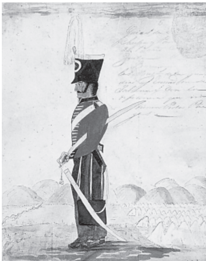
Aliriventz, Guías de Bogotá, 1823, acuarela, 23 x 18,8 cm. Museo Nacional. Bogotá

ble o que haga parte de una “identificación política” que se percibe como necesaria o inevitable. Simplemente constatamos el hecho de que la interacción social en las condiciones de interdependencia que tienen lugar en diferentes territorios del país promueve la permanente acción recíproca entre pobladores y actores armados 1 .