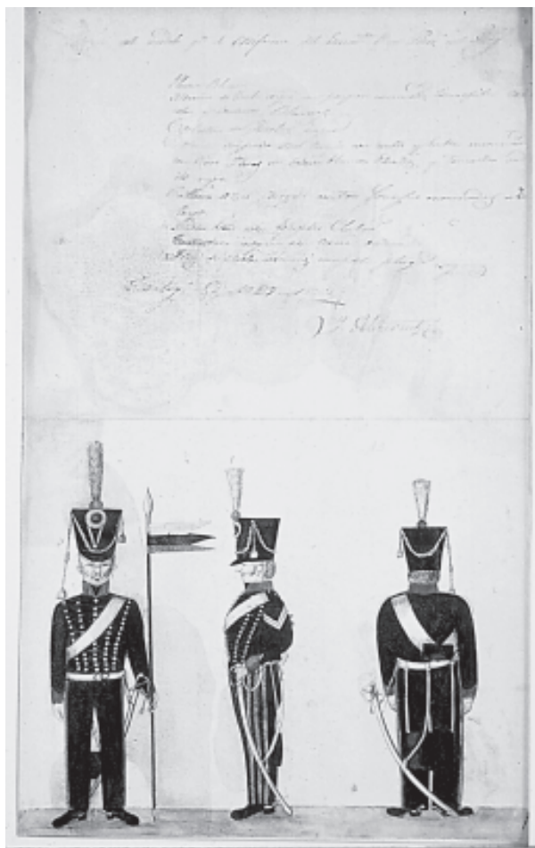
Aliriventz, Proyecto de modelo para uniforme del Escuadrón 41 de Húsares del Magdalena, 1923, acuarela, 40,9 x 25,2 cm. Museo Nacional

Es preciso insistir en la formulación de que los pobladores no protegen a los subversivos, sino a “sus muchachos”, no apoyan la subversión sino la vida de sus jóvenes. Tal desplazamiento en la forma de pensar el problema nos exige preguntarnos ¿cómo se vincula este tipo de afectos a la política estatal de participación de la ciudadanía en la derrota de los actores armados al margen de la ley? Y nos exige revisar ¿cómo comprendemos los vínculos políticos?, ¿qué papel le damos a la vida afectiva en la comprensión de aquello que llamamos un “proyecto político”, una democracia? Y es que la discusión sobre el desarrollo del conflicto suele centrarse en que los actores armados al margen