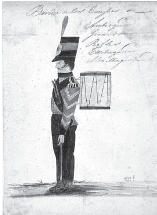
Aliriventz, Banda de los cuerpos de Antioquia, Girardot, Rifles, Cartagena y Alto Magdalena, 1823, acuarela, 21 x 15,7 cm. Museo Nacional

Y es que la condena de las formas de “regulación social” impuestas por los actores armados tiende a olvidar dos importantes procesos: