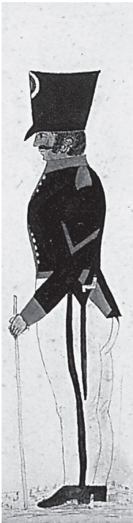
Aliriventz, Batallón de Antioquia, 1823, acuarela, 25 x 19 cm. Museo Nacional

• La segunda situación tipo que queremos reseñar tiene que ver con la valoración política que reciben los actos de “supervivencia”. En los últimos años distintos grupos de pobladores han protagonizado importantes movilizaciones a propósito de las negociaciones del gobierno nacional con los actores armados al margen de la ley, así como frente a políticas específicas adoptadas por el mismo gobierno nacional. Entre ellas se destacan las marchas de los llamados “cocaleros”