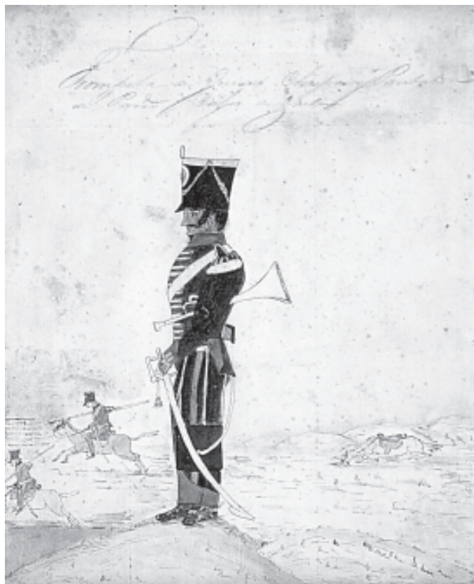
Aliriventz, Trompeta de guías, 1823, acuarela, 23 x 18,8 cm. Museo Nacional

sar la comprensión habitual de la política tiene que ver con lo que hemos llamado “dinámica de regulación”. Los grupos armados que controlan las diferentes comunidades del Bajo Atrato en el Chocó han decidido prohibir la salida de la gente hacia otras comunidades o hacia las cabeceras municipales. La movilización por el río está restringida, incluso la pesca. Las personas que necesitan salir de su comuni-