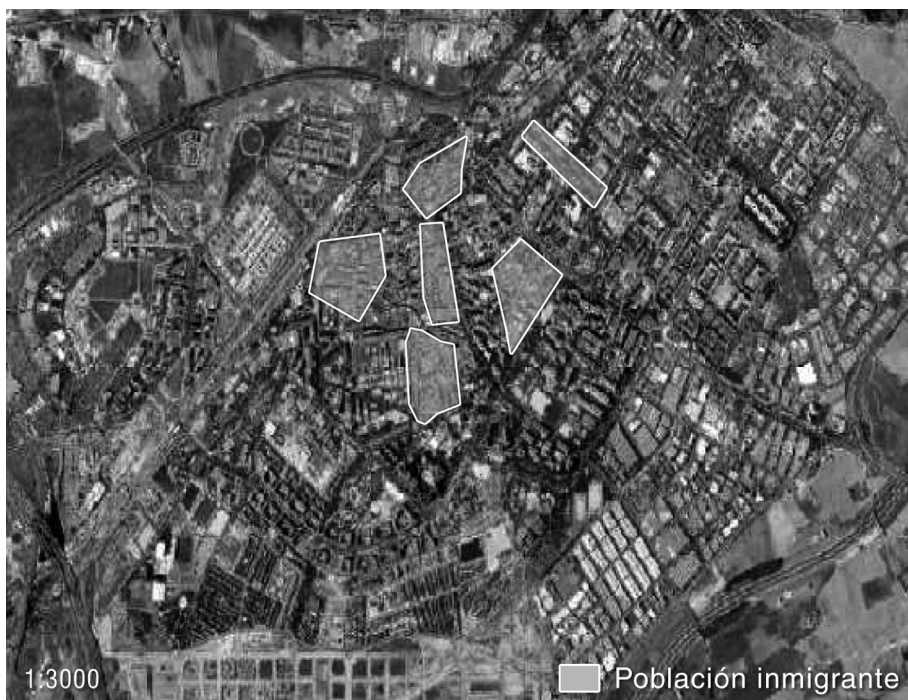
Figura VIII. Intensidad de población inmigrante en Alcorcón

muestra una tendencia al asentamiento de población inmigrante en el Barrio de San José de Valderas.