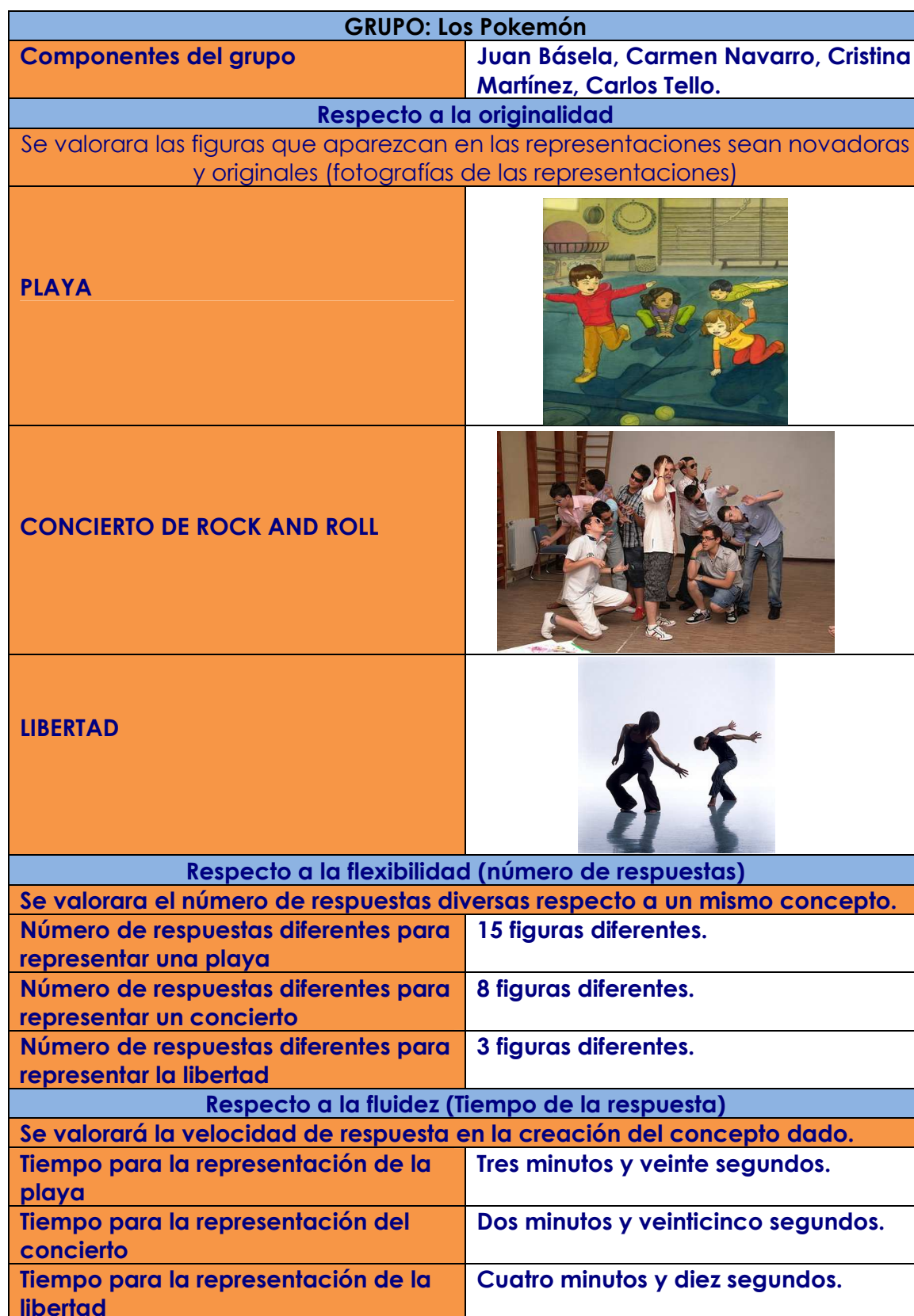
Tabla 2. Ficha de Flashes Pablo Del Pozo Moreno