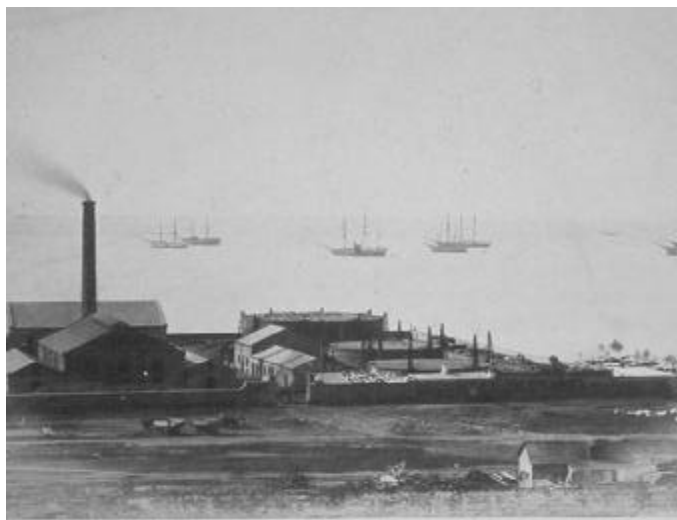
Argentina, c. 1895

Si pretendemos explicar relaciones entre ética, compromiso político e investigación académica, debemos interrogarnos acerca de los sujetos involucrados. En cualquier situación social hay diversos actores e intereses involucrados, desde el supuesto interés común, hasta el de un grupo excluido, que a su vez puede no coincidir con los de los líderes de ese grupo, sin mencionar los académicos y del propio investigador. Generalmente, los intereses de tantas personas y grupos no presentan una armonía perfecta y son evidentes claras y difusas disyuntivas ¿Por quién optar? ¿Por qué optar? ¿Cómo hacerlo?