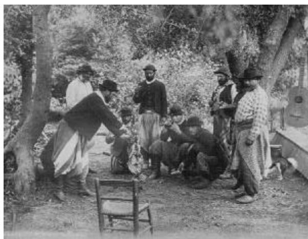
Gauchos, Argentina, 1895

etnográfica y comunicacional sobre los inmigrantes bolivianos a Buenos Aires. Los bolivianos son, en la Argentina, uno de los grupos más discriminados y estigmatizados. Esto yo ya lo sabía y lo consideraba evidente. No pretendía demostrarlo. Buscaba estudiar, en cambio, cómo respondían los bolivianos a esa discriminación. Había múltiples respuestas, en escenarios cotidianos y rituales, en interacciones personales y en contextos públicos. Historizando estos procesos resultaba claro que los marcos rituales y públicos estaban creciendo en Buenos Aires. En otras palabras, que los bolivianos se organizaban culturalmente para responder a situaciones crecientes de exclusión. Que no permanecían pasivos ante los estigmas, sino que construían identidades.