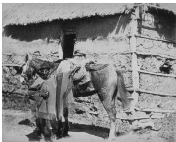
Argentina, c. 1900