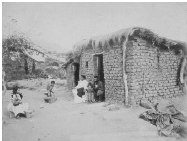
Argentina, c. 1900

Por ello, comienzo con un relato de mi trabajo de campo. A mediados de la década de 1990 desarrollé durante varios años una investigación