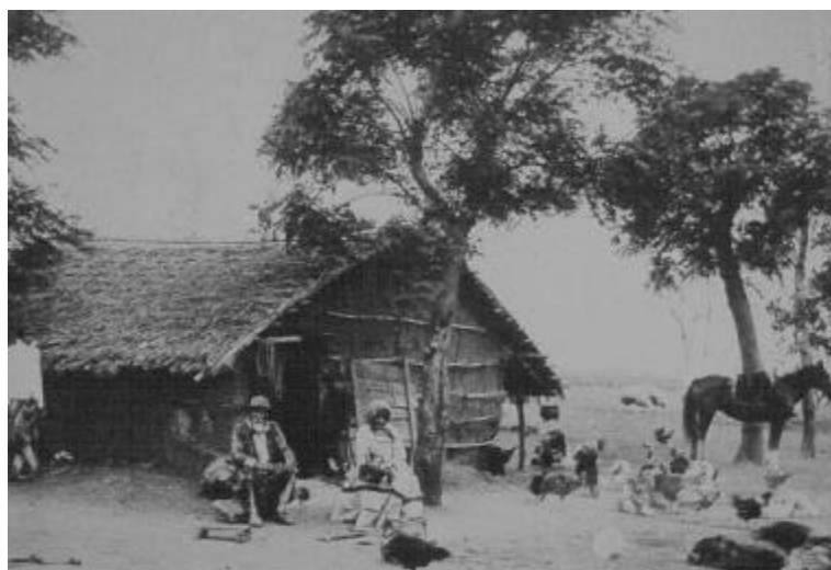
Argentina, c. 1900

Una lectura superficial podría suponer que estamos convocando aquí a un argumento positivista. En realidad, estamos diciendo exac-