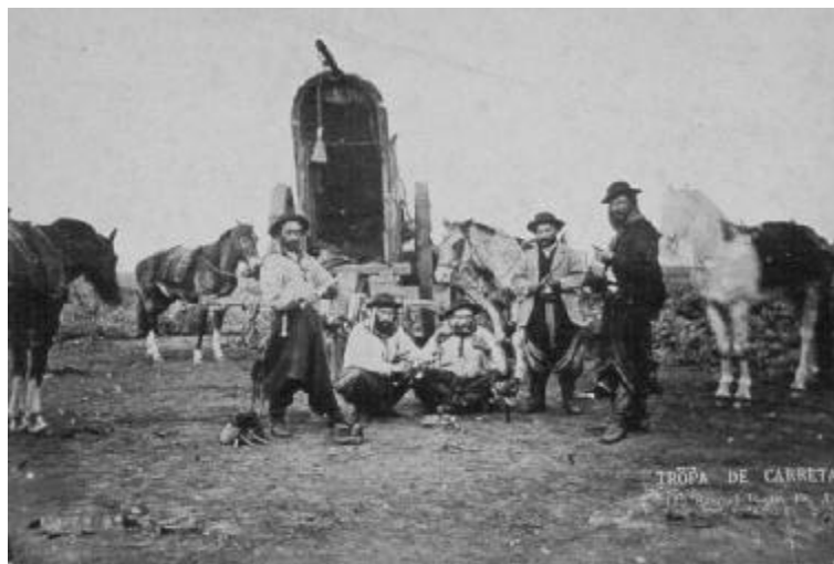
Tropa de carretas, Argentina

La diferencia cultural, entonces, puede ser utilizada a la vez para intentar subordinar y dominar a grupos subalternos, como para reivindicar los derechos colectivos de esos grupos. Por ello, el reconocimiento de diferencias culturales no tiene un valor ético-político esencial, sino que su