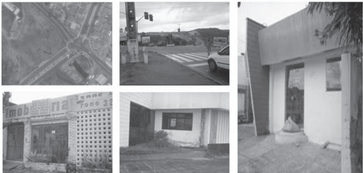
Figura 1. O cruzamento

O lugar, espaço intersticial, suporta grande fluxo de veículos, sem equipamentos para o tráfego de pedestres, desestimula a passagem e repele a permanência das pessoas (ver Figura 1). Uma das avenidas desse cruzamento situa um fim-de-bairro, sem marcar, no entanto, o início de outro, uma fronteira com o nada. É via de entrada por um caminho longo e vasto, ponto de passagem por excelência, onde as pessoas não se demoram pela simples falta de acolhida. Parecia sempre muito deserto, silencioso; era, por isso, estranho e inóspito. E eu tinha a constante impressão de que somente aqueles jovens é que sabiam estar ali.