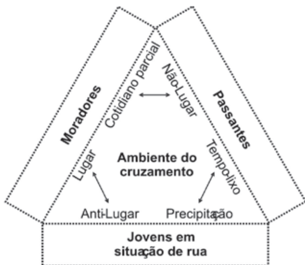
Figura 2. Efeitos das práticas de espaço sobre o ambiente do cruzamento e seu entorno

Giddens (2003) propõe que as formas de interação que garantem o que chama de integração social são aquelas ocorridas em situações de copresença . Elas favorecem a reciprocidade de práticas entre atores sociais. No entanto, as formas de interação ocorridas no ambiente do cruzamento não configuram condições plenas de copresença , nem entre os meninos e os motoristas e, tampouco, entre aqueles e os moradores. A rua, de certo modo, desfavorece a interação social e as relações entre os meninos e os outros, especialmente, os moradores. Produz-se uma lacuna de convivência no cruzamento, entre os moradores e os meninos, que reduz suas possibilidades de ancoramento ao espaço. Toda história produzida ali é sempre pronta para ser esquecida, e as formações identitárias, assim disponíveis a eles, são aceitas enquanto não se podem rejeitar. Portanto, se suas práticas de espaço lhes dispõem relações sociais, história e identidade, também lhes privam disso.