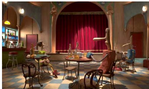
Contrarrestando los efectos del alcohol con grandes dosis de café (izqda.), y el entorno del Teatro Tonto en la película (dcha.)

Sin embargo, el uso de personajes simples en animación, como Este , que no posee ni pelo, ni orejas, ni nariz, ni vestimenta, que no es gordo ni flaco, etc., presenta grandes inconvenientes a la hora de conseguir un acting creíble. Pascual encontró en este hecho un gran reto. “ Este no tiene cejas, ni párpados, ni pupilas, pues los ojos son dos agujeros en forma de línea vertical. Así que, para animar cualquier expresión o cambio de ánimo (enfadado, aburrido, entusiasta, cansado,