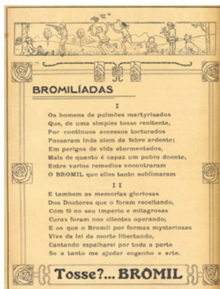
Figura 2: As Bromilíadas , publicado inicialmente em 1908; retirado do Almanaque da Comunicação em 2011.

Apresentamos, a seguir, o exemplo de um anúncio publicitário, também concebido na interação do gênero discursivo publicitário com o universo discursivo literário, que nos permitirá compreender a dimensão da intertextualidade, conforme proposta por Genette (2006).