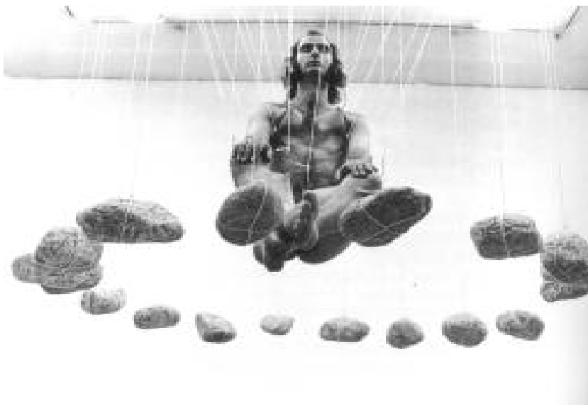
Stelarc en sentado - balanceándose: performance para piedras suspendidas 1980

a través de la oración, se convoca la sangre de Cristo para lavar, cubrir, liberar y proteger los espacios, las personas cercanas que no se encuentran en el ritual y a los propios cuerpos de las y los participantes, con el objetivo de que no puedan ser atacados por el enemigo y salvaguardarlos. Este acto se realiza con el fin de transformar a los espacios, a las personas, y a los objetos en sagrados; en ese sentido no es importante si los objetos o los sitios son o pertenecen al “mundo de la carne”, pues en este acto se transforman en sacros.