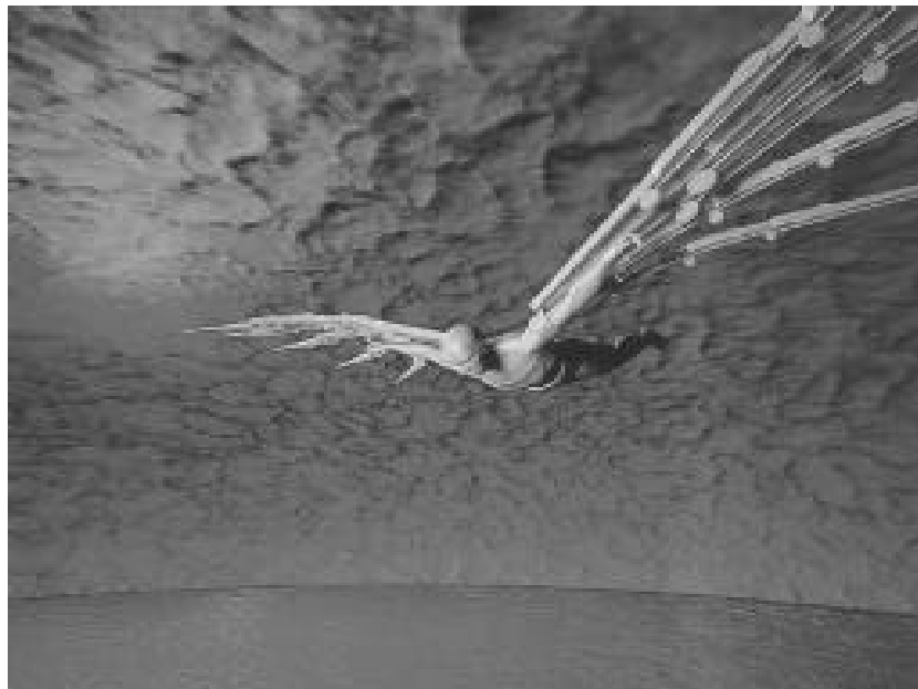
“El sueño de Leonardo”

El paroxismo furtivo, dirá Maffesoli (1996), hunde sus raíces en lo cotidiano, en lo común y esto es lo que mejor caracteriza lo sagrado. Un mundo contenido donde cada acto, cada experiencia, cada sentimiento, sueño, pasión, pensamiento, en suma, toda la vida psíquica se afianza en el