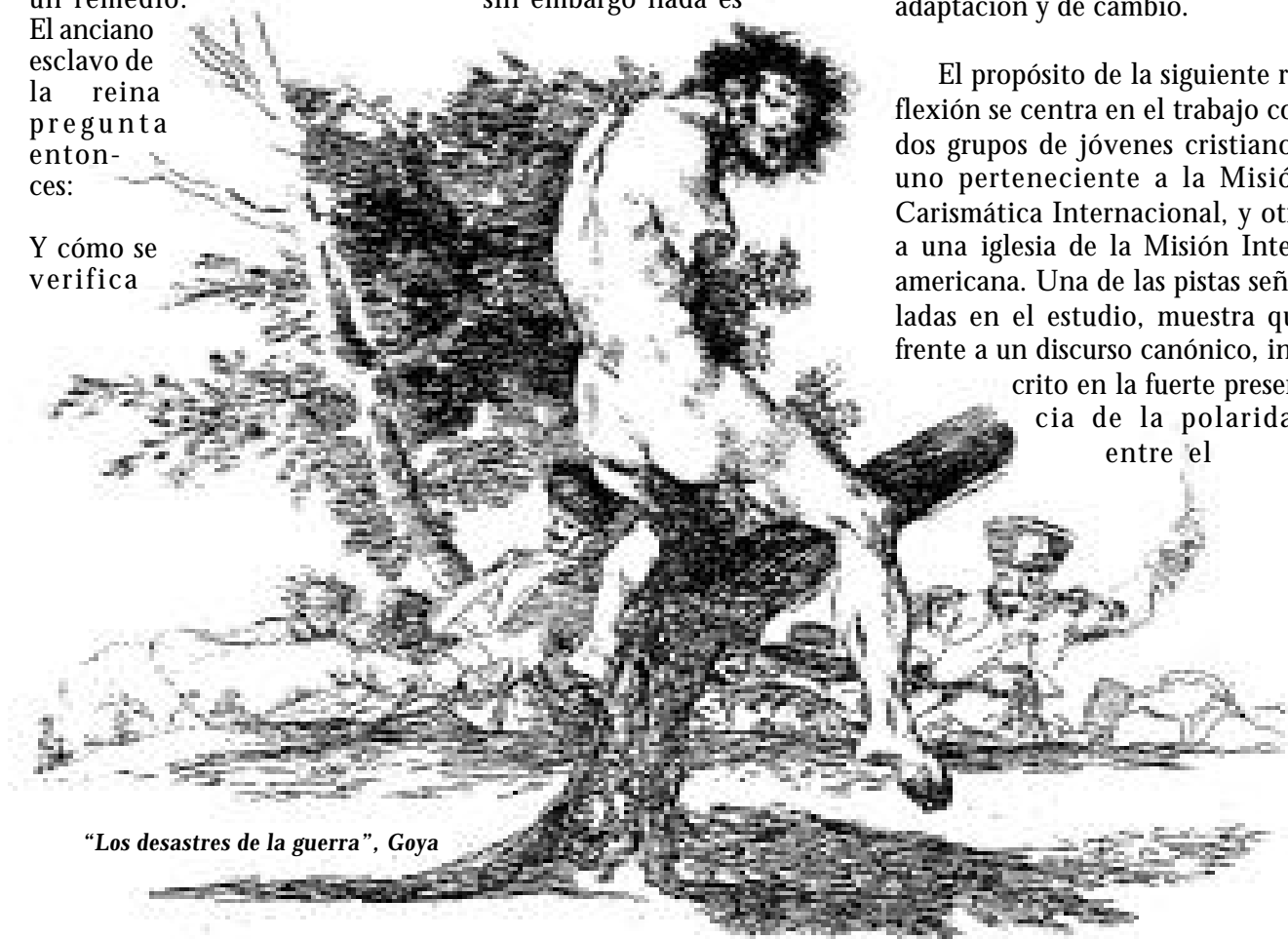
"Los desastres de la guerra", Goya

El propósito de la siguiente reflexión se centra en el trabajo con dos grupos de jóvenes cristianos: uno perteneciente a la Misión Carismática Internacional, y otro a una iglesia de la Misión Interamericana. Una de las pistas señaladas en el estudio, muestra que frente a un discurso canónico, inscrito en la fuerte presencia de la polaridad entre el