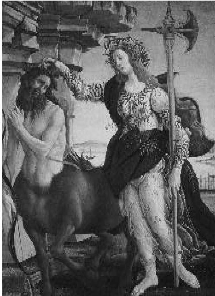
“Palas y el Centauro”, 1482. Sandro Botticelli

tecnologías que hacen del cuerpo lo aséptico y lo ortopédico. Todo se integra dentro de este orden, con fronteras muy bien definidas, se delimita y canaliza toda la existencia corporal hacia un mundo angelical; la abstención de todo acto carnal, la castidad exacerbada, retomando a Maffesoli (1996),