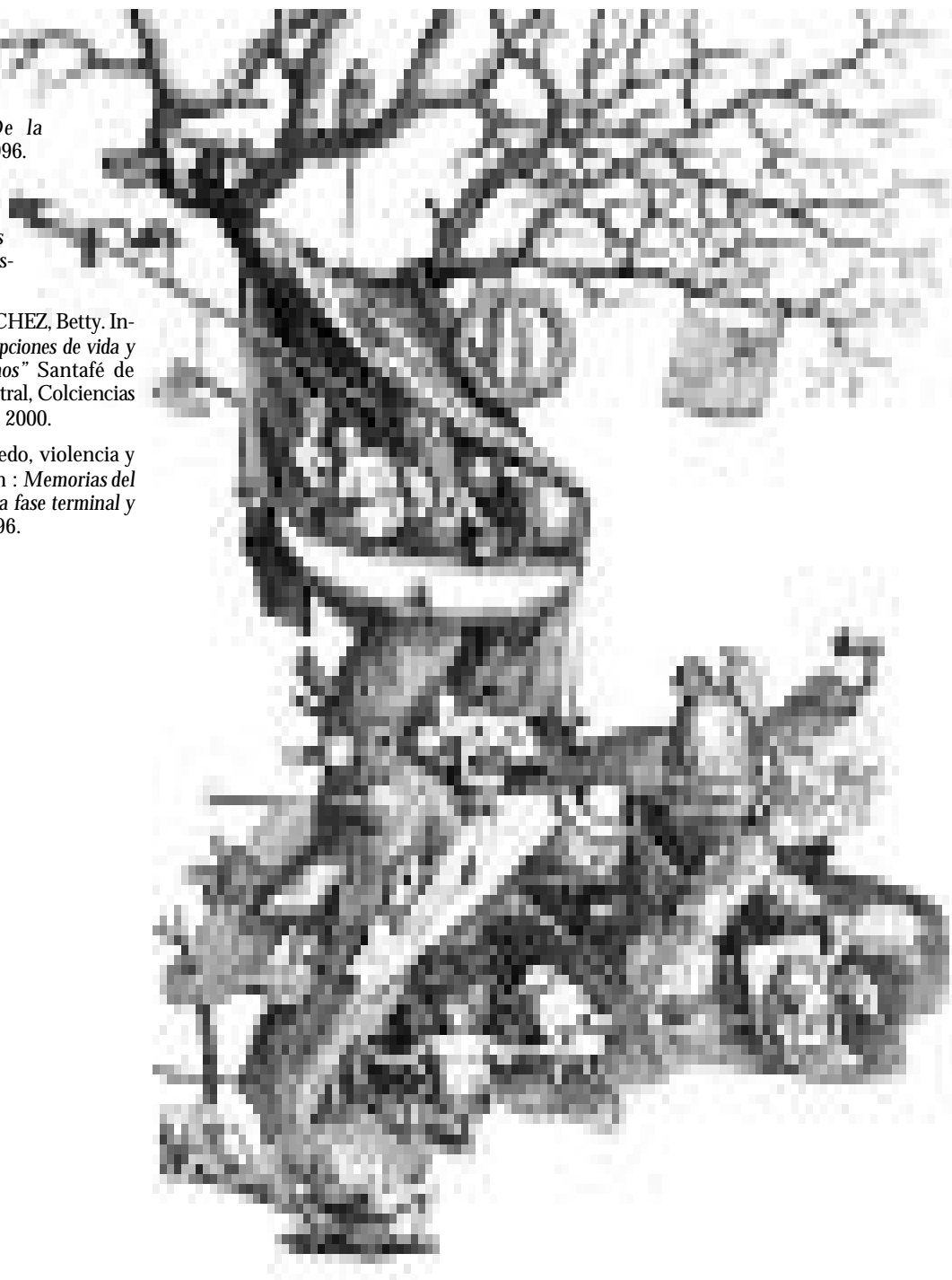
"La paciencia" (detalle). Grabado de Peter Bruegel (1525-1569)