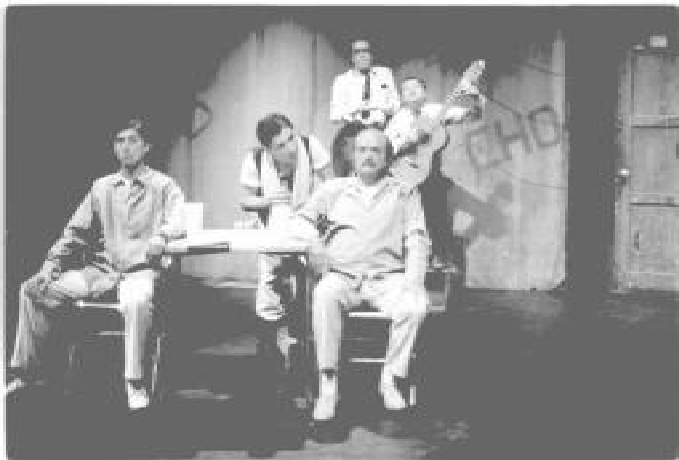
El paso 1988.

tación más fuerte la ha recibido Santiago García de la realidad. A ella acude no para calcarla, sino para reconstituirla o reinventarla como un universo estético de ficción que, como paradoja, resulta siendo muchas veces más verídico que la realidad misma y con más fuerza premonitoria que las proyecciones de las ciencias sociales y económicas.