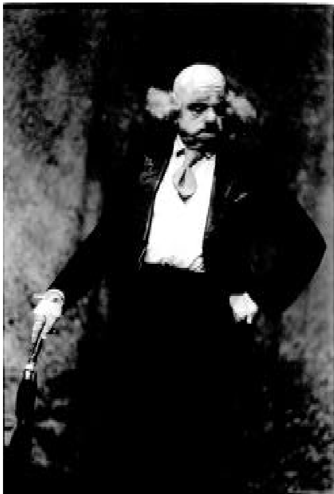
Maravilla Star, 1993