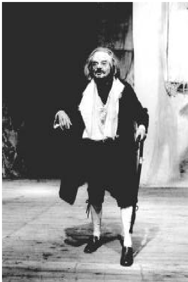
El diálogo del rebusque. 1981