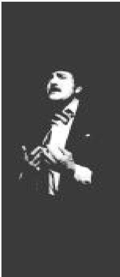
Los diez días que estremecieron al mundo. 1977

Entre las influencias principales de García se puede reconocer,