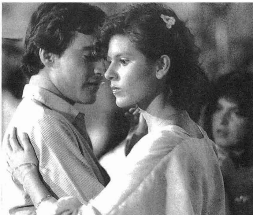
"Visa USA" de Lisandro Duque.

unidad reproductiva (reposición generacional) y unidad económica (actividades de producción y consumo cotidiano de alimentos y otros bienes y servicios para la subsistencia). La familia como idea, aunque tiene un sustrato biológico ligado a la procreación, debe ser entendida, en sus diversas formas, como una institución social que trasciende la normatividad de la sexualidad y la filiación.