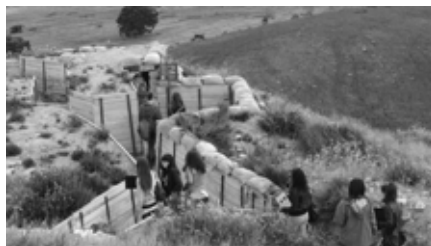
Figura 6. Recorregut per les trinxeres del Merengue.

A partir d'un recull de fonts primàries, es proposa a l'alumnat un treball per a comprendre les conseqüències que van derivar-se de la victòria franquista per a la població de Catalunya: la instauració d'una dictadura militar, l'exili, la repressió política, laboral i cultural, etc.. En concret es treballa l'acondicionament a Balaguer d'uns locals per utilitzar-los com a presó i el nombre de presos que hi van ser reclosos.