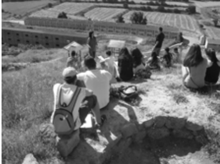
Figura 7. Alumnes atents a les explicacions per construir el rol d'un soldat de la lleva del biberó.