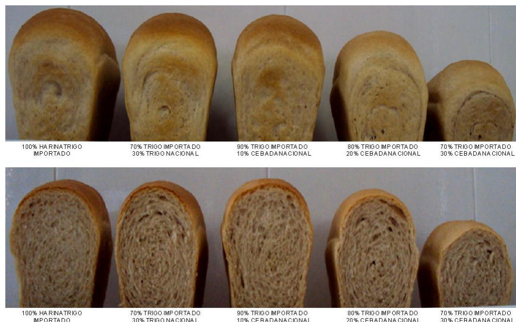
Figura 2. Panes elaborados con las diferentes harinas

*Letras diferentes en una misma columna indican diferencias significativas (Tukey, p \leq 0.05 ) en los diferentes panes.