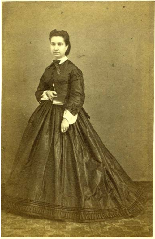
(Imagen 3)

Profesionalmente viaja por Andalucía en multitud de ocasiones y, como ya he comentado, en varias de ellas pasa por la provincia de Jaén, entre otras cosas para realizar las imágenes de las obras públicas en España 8 fotografiando en nuestra provincia tres puentes 9 y tres tendidos ferroviarios 10 ;