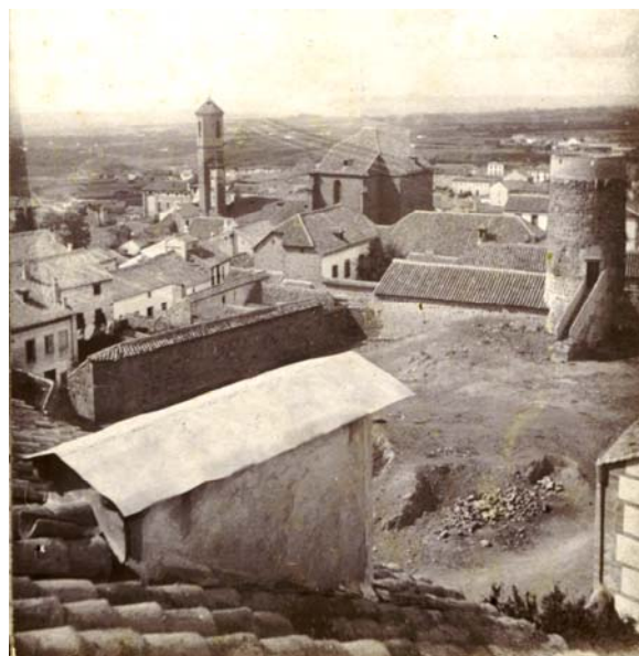
(Imagen 1) Fragmento de la estereoscópica de José Cabo

Está tomada desde la parte trasera de una casa en la propia calle Los Álamos. Se ve el torreón en primer plano, Santa María detrás; más allá, las casas de la calle Santiago y algunas construcciones del barrio de Santiago. Al fondo se aprecia el antiguo molino de Pedro Melchor y lo que por entonces se llamaba el ranal , no habiéndose iniciado la construcción del barrio circun-