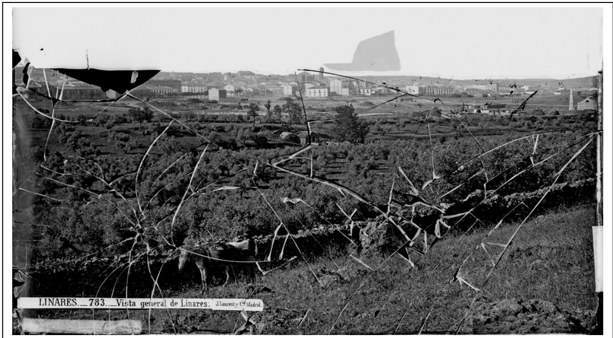
(Imagen 9) Vista General de Linares.

ne derecho a todas las ventajas cometidas por los tratados a los súbditos franceses en España” 30 . La misma se otorga en Linares el 21 de septiembre de 1876, aunque seguramente se le entregaría al solicitante algún tiempo después, dado que los medios de la época no daban para más. Puede ser que buscarse un motivo para venir a Linares y admitiese un encargo para realizar la fotografía que se muestra anteriormente ( imagen 9 ) como Vista general de Linares .