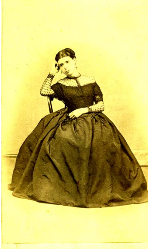
(Imagen 4)