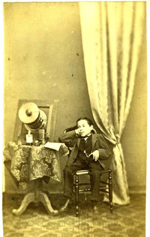
(Imagen 5)

Carnicería, 52, manteniendo su estancia continuada hasta 1875 14 .