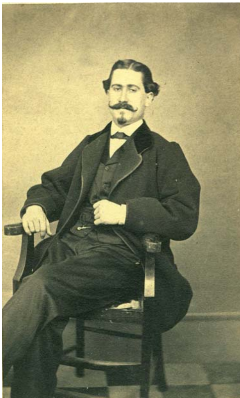
(Imagen 6)

Está datada la presencia de J. Laurent en Andalucía en 1871 17 , justo el año en que Vicente Daillencq sale de Málaga y llega a Linares. Posiblemente, además del periplo por las provincias de Granada, Córdoba, Cádiz y Sevilla que debió recorrer por ferrocarril 18 y en las que está documentada su estancia, acudiese a Málaga a localizar a su cuñado.