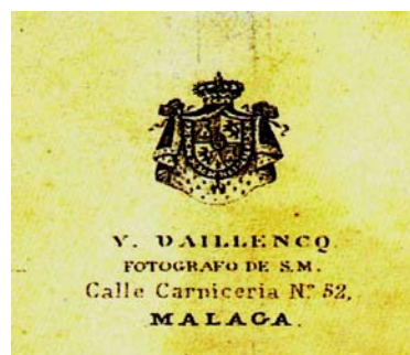
(Imagen 11)

Como se puede ver, preguntarse por una imagen da lugar a una concatenación de datos que permite conocer mejor nuestra historia. ¿Es importante saber quién realizó la fotografía? Puede que para mucha gente sea indiferente, pero para los interesados en la fotohistoria, puede ser tan importante como la fotografía misma. Si esa imagen existe, ¿por qué no van a existir muchas más de ese tipo? ¿Quién las tenía?, ¿Dónde están? ¿Por qué ésta ha aparecido y otras no? Estamos en el inicio de esta investigación y seguir por este camino puede dar lugar a encontrar más imágenes de este tipo que, en definitiva, es lo que nos interesa, como forma documental del conocimiento de nuestra historia.