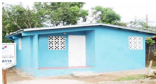
Figura 3: Unidad Básica de 36m2, construida con el Programa PARVIS para familia de cinco miembros

Este tipo de programas (con nombres distintos) han sido ejecutados por sucesivos gobiernos muy particularmente desde 1990. De esta forma, y en menoscabo de las necesidades de la población, se generan hábitats que obstaculizan la sostenibilidad social y ambiental, amén de entorpecer las relaciones de gobernabilidad urbana y de negar el derecho a la ciudad a sus ocupantes. Mientras se construyen estas viviendas de 36 metros cuadrados, en urbanizaciones que carecen de espacios y equipamientos