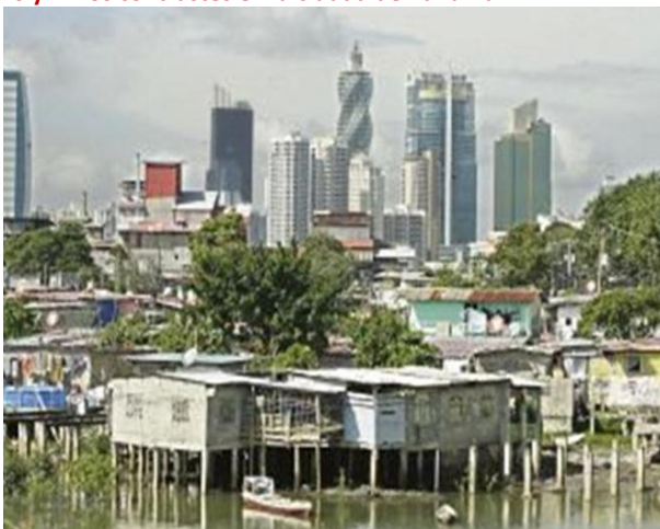
Figura 6 y 7: Los contrastes en la ciudad de Panamá

3.405.810 habitantes 14 en 75.517 kilómetros cuadrados. Coexisten sectores dinámicos, actividades modernas, estilos de vida sofisticados e integrados a la sociedad global, con sectores y áreas pobres intensamente excluidas de las oportunidades económicas, sociales y culturales, donde los desposeídos, los desempleados y los jóvenes sin oportunidades conforman el 32,7% de la población que vive bajo el nivel de pobreza (ver figuras 6 y 7). De estos, el 14,4% (más de medio millón) vive en condiciones de pobreza extrema, lo que confirma que, a pesar de haber registrado un sólido crecimiento económico y un crecimiento del PIB a una tasa media anual del 4,9% entre 2000-2006 y un crecimiento de 10,7% en 2008, de 2,4% en 2009, de 4,5% en 2010, y de 8,1% en 2011, para alcanzar un PIB de US $13.912 (Banco Mundial 2011) y de estar caracterizado como un país de desarrollo alto por el Sistema de Naciones Unidas, la pobreza sigue siendo un problema grave.