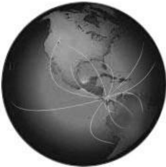
Figura 1: La posición geográfica de Panamá y su valor estratégico para el intercambio de mercancía y pasajeros

allá por 1519, se pensó en la Ciudad de Panamá no porque fuera una tierra favorable a la agricultura o por el buen clima, sino por su vocación de camino entre regiones y culturas (ver figura 1). Así, la ciudad fue creciendo bajo el entendido del destino manifiesto del país: camino de paso, puente de riqueza ajena, lugar de tránsito; “una ciudad que vivió condenada a no ser otra cosa que tierra de paso (...) los vecinos que ahora son contratantes y no piensan estar en ella más tiempo de cuanto puedan hacerse ricos, y así idos unos, vienen otros, y pocos o ninguno miran por el bien público” (Mena-García: 1992: 22).