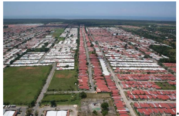
Figura 5: Barriada de construcción masiva en Arraiján- Panamá

En Panamá, la distribución por edad señala que la mayoría de población es joven; muchos viven cada día con la esperanza de un futuro mejor, pero probablemente no comprenden las razones que explican sus dificultades 13 . Panamá es un país de intensos contrastes en el que conviven unos