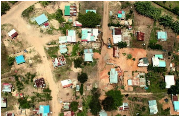
Figura 4: Asentamiento espontaneo en Las Garzas de Pacora

Mientras los distintos gobiernos ejecutan esos programas como respuesta al déficit habitacional nacional, señalado por el MIVIOT en 125.014 viviendas para el año 2011 (cifra elevadísima para una sociedad de gran riqueza como la panameña), la ciudad informal crece persistentemente. Las tomas de tierras (en suelo público o privado) y los asentamientos espontáneos o irregulares, han llegado a ser un porcentaje significativo de la expansión y construcción de la ciudad, lo que evidencia, entre otras cosas, que los programas antes mencionados para la población sin capacidad de pago son insuficientes para satisfacer la necesidad de vivienda 8 . Sin embargo, los registros oficiales solo reconocen actualmente unos 488 asentamientos donde viven 348.412 personas. La población que no califica para los programas del MIVIOT, vinculada a labores informales y marginales, acude a un proceso popular de acceso al espacio urbano para resolver sus necesidades de vivienda. Siempre se ha tipificado como delito ocupar tierras sin el correspondiente título de propiedad. La urbanización ilegal es tolerada por el Estado, ya que atenúa la demanda y reduce el déficit habitacional (ver figura 4).