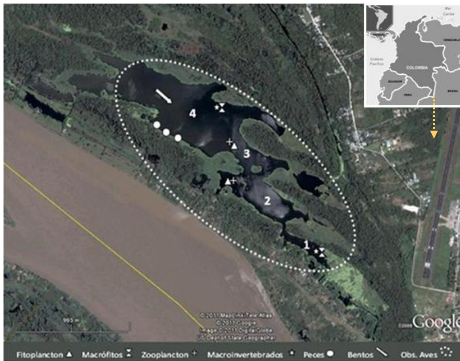
Figura 1. Zona de estudio. Sistema de lagos de Yahuarcaca con indicación de convenciones según los grupos muestreados. Fuente Google Earth 2011.

El fitoplancton fue colectado usando el agua que pasaba a través de la red de zooplancton en frascos plásticos de 250 mL y conservados con solución de transeau en proporción 1:1. En laboratorio las muestras fueron observadas con microscopio Olympus CX31 e identificadas taxonómicamente a grandes grupos.