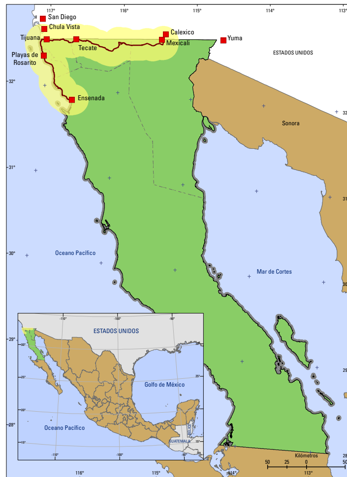
Figura 1. Localización geográfica del corredor económico Ensenada-Mexicali.