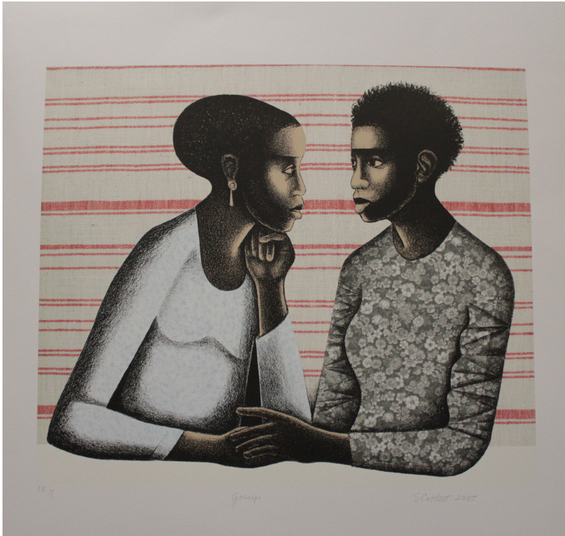
Gossip (Chismeando) , litografía, 61 x 57, 2005