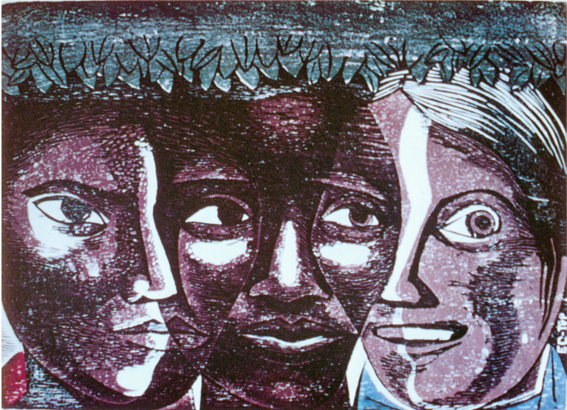
Women of America (Mujeres de América) , xilografía, 33 x 24 cm, 1963