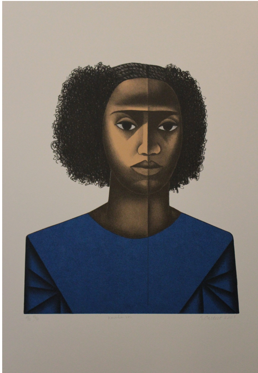
Keisha , litografía, 56 X 75 cm, 2010