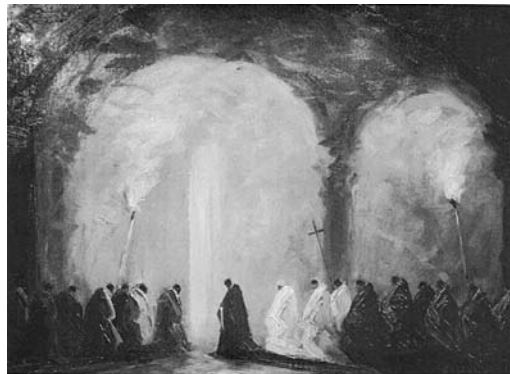
Figura 4: Procesión