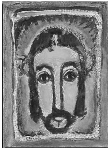
Figura 2: La Santa Faz, 1946