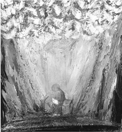
Figura 10: nacimiento