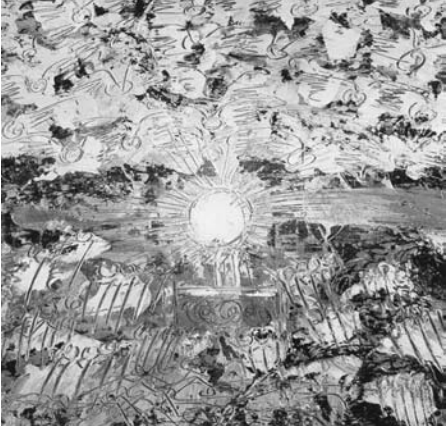
Figura 11: Eucaristía I, 1960