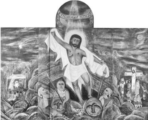
Figura 15: al tercer día resucitó