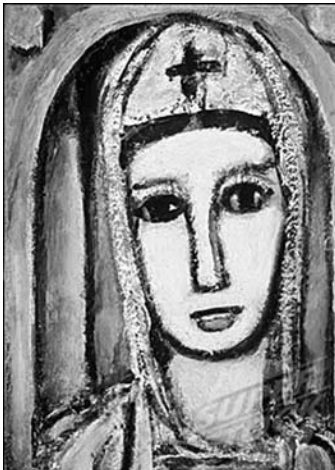
Figura 3: La Verónica, 1945