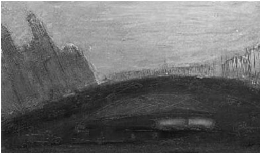
Figura 7: Mexico City 4, 1954