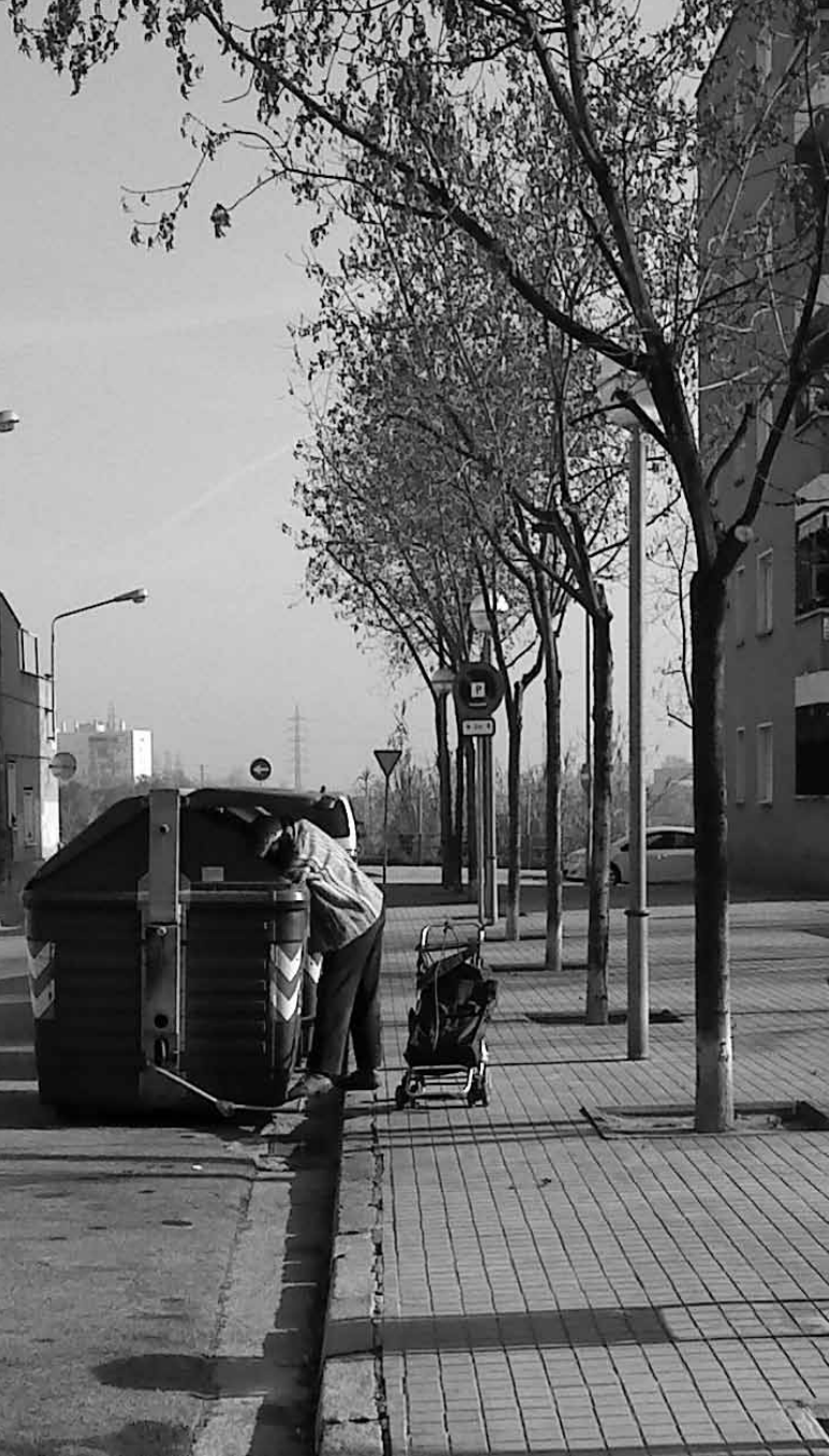
Treballador de l'espigueig amb el vehicle indispensable per a la tasca en qüestió. Sabadell, 2010.

En el mateix procés constructiu, hi observem alguns punts destacables que ens ajuden a caracteritzar la noció d'arquitectures de la dignitat.